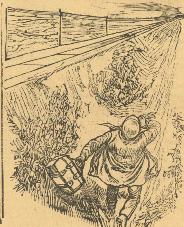
Ρε σιδηροδροματζή, στίσου ρε μ' ἄφησες ὄξω.

Τῆς ἐπιστολαῖς τῶν γραμμάτων και τῆς ἰδιαίτερης πληροφορίας θὰ τῆς δημοσιέψω αὔριο, και ὅσκις περισσέψουν παλι τὸ σάββατο, και τῆς ἄλλαις τὴ Κυριακὴ. Φινίτο.