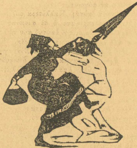
Τσανωμένες ποιὰ νὰ πρωτομπῆ στὰ μπάνια.