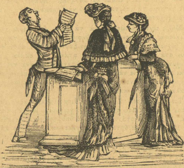
Τῆς διαβάσει τῆς κουταμάρας τῆς «Νέας Ἐφημερίδος».

Ἐγὼ θὰ πάω νὰ τὴν ὄω κι' ἂν θέλετε ἐλάτε καὶ σεις.