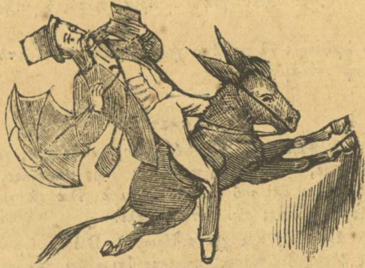
Γυμνάζεται για τὸ ἵπποδρόμιο τοῦ Φάληρου.