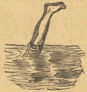
Κάνει βουτιά στὸ Κεφαλάρι