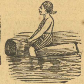
Νπάνια ρέας μύδας

Αὐτὰ μᾶς γράφου ἀπὸ τὰ Μέθενα, καὶ ὅσοι θέλετε νὰ καλοπεράσετε καὶ νὰ ἐξαχρειώσετε καὶ τῆς γυναικῆς σας, ἐμπρὸς στὰ Μέθενα.