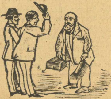
Ἄρ φεύγαρ οἱ χρυσογάδοι ἔτσι θὰ τοὺς καταβοδῶμε.

Τέλος πάντων ἐγὼ κάνω τὸ καθήκον μου νὰ σὰς εἰδοποιήσω γιὰ τὴν μανία τοῦ διευθυντῆ καὶ σεῖς πλέον κάνετε ὅ,τι σὰς φωτίσῃ ὁ διάολος, γιὰ τὴν αὐτὸς φαίνεται νὰ σὰς φωτίσῃ ὡς τόρξ καὶ δὲν θέλετε νὰ βάνετε γνῶσι. Βάλτε τὴν λοιπὸν, πρὶν σὰς τὴν βάνῃ ὁ διευθυντὴς μετὰ τὴν κατώγα του.