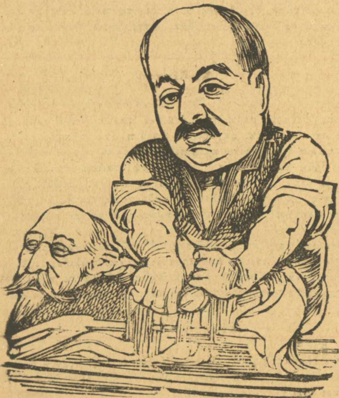
Νὰ σὲ στύψω μεσαρο-Κολλιγᾶ νὰ βγάλω τοὺς φέρους.

Μὰ τί δινόλο πάλι σεῖς, νοικοκυρέοι ἄνθρωποι, καί μὲ παραδες, ἀφοῦ μάλιστα κεδίσσατε καί τόσα στοιχήματα,