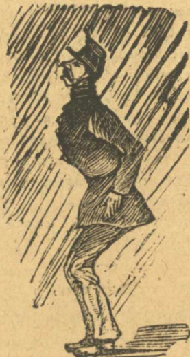
Κάνε τίρα γυμνάσια μ' αὐτὸν τὸν καιρό.

σεῖς πᾶτε νὰ μοῦ πιπιλίσετε τὸ μυαλό μὲ τὰ ἄτα σας καὶ παραμέντα σας. Μὰ ἐσεῖς ἐν ἔχετε πλιό νισάφι. Ἄμὰν, ποὺλλὰ γράμματα γιὰ στέλνετε, ποὺλλὰ πράγματα γράφετε, νισάφι ἐν κάνετε, οὐ χωρεῖ τῷ στόματι μου γράψε ὅσα γράφετε. Ὅχουνοὺς διαιόντρου κουλούκια, καί μεθαύριο σᾶς τὰ γράφω οὐλα μονοκοπανιάς.