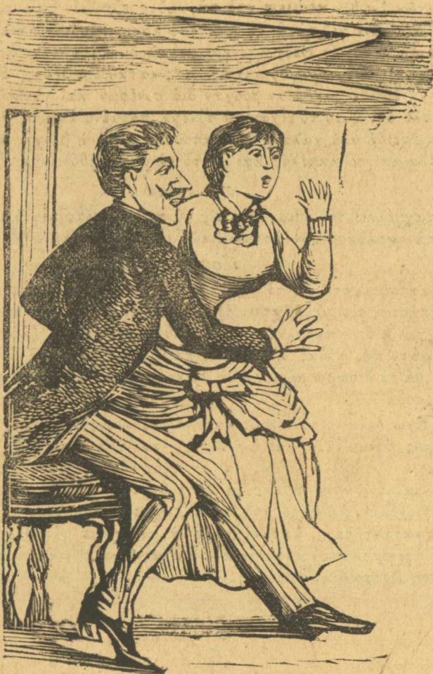
Ἀπάνω στό γούστο τους, ἔπεισε καί τὸ ἀστροπελέκι.