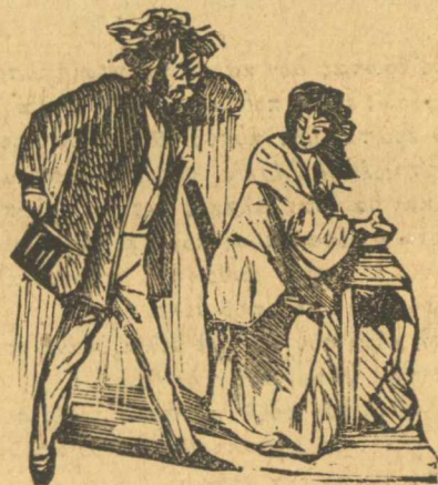
Ἰδοὺ κατὰστασις πραγμάτων βριχῆς, κυρία μου.

Μ' αὐτὴ τῆ βροχῇ δὲν σὲ πᾶω οὔτε μὲ πενήντα φράγκα σὶδὸ σπῆι σου. νὰ μὴ πληρώνετε μιὰ καροτσάδα, μόνο τοὺς κοροϊδεύετε τοὺς ἄνθρώπους, στέλνοντας αὐτοὺς ἀπὸ τὸν Ἄννα στὸν Καϊάφα. Ὅριστε κύριε τώρα ποῦ ἀπὸ τῆ φούρκα τους κατάντησαν νὰ σᾶς βάνουν καί στὸν Παλιάνθρωπο γιὰ νὰ σᾶς μάθῃ ὅλος ὁ κόσμος ὅτι εἶστε κακοπληρωτίδες, ἔτσι μούπαν νὰ σᾶς τὰ γράψω καί ἔτσι σᾶς τὰ γράφω, μ' ὅλον ὅτις αὐτὰ τὰ γραφόμενα εἶναι καί λίγο ἀτομικά, ἀλλὰ ἐγὼ σᾶς τὰ γράφω μὲ τρόπο ποῦ νὰ φαίνεται πῶς δὲν εἶναι τάχα ἀτομικά. Καρότσα αἰ;