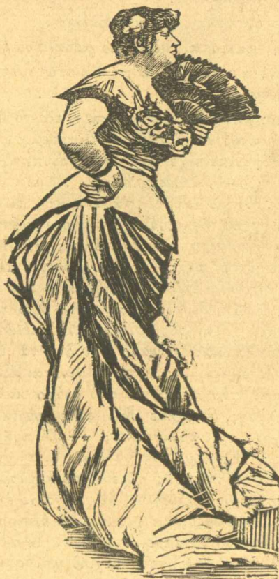
Ἡ Εὐανθία μου

Σεῖς μπορεῖ ν' ἀγαπάτε τῆς ἀδύναταις, ἀγαπᾶτέ ταις, δὲν ἐπεμβαίνω, λοιπὸν ἀφήσατέ με καὶ μένα νὰ κἀνω τὸ κέρη μου. Πῶς εἶπατε; Εἶνε ἡ ἰδέα μου ορακμένη; Λαθιάνεσθε. Δὲν θέλω, ἔτσι θέλω, ὦ διαδούλε, μὲ τὸ ζόρι θὰ μού ἐπιβλάψετε σεῖς τὴν ἰδέα σας; Σᾶς εἶπα, ἐγὼ εἰμαι πεισματάρικο ζῶον,