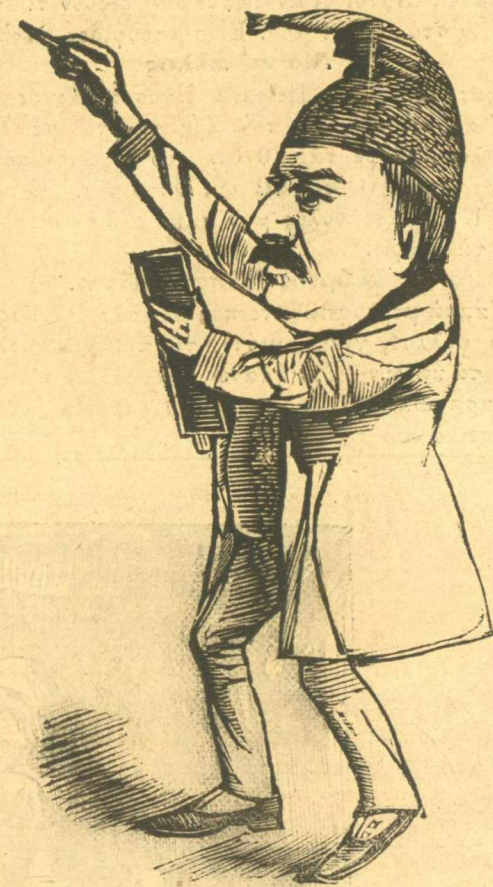
Σήμερα πού κρατώ τό γαρτοφύλακι, είμαι φιλοβασιλικός καί κ' άς φορώ σκούφο δημοκρατικό. Δημοκρατία ! Άλλ' όταν ήμαι αντίβασιλικός Βασιλεία Καί τά γράφω στην 'Ωρα, γιατί είνε τής ώρας πράγματα.

— Ά, έτσι, νά τότενας ένας φράγκος. 'Ολας τας φλυαρίας αυτές, κύριέ μου, σάς τας λέγω, δια νά λάβετε μικρό δείγμα, περί του τί συμβαίνει μέ τους τελωνοφύλακας του Πειραιά, καί των μωλιάτικων. Αί πλέον, αυτό δέν ύποφέρεται. Είναι κακούργημα των καουργημάτων του καουργήματος.