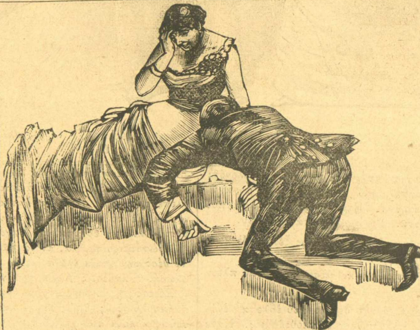
Δευτέρα θεάς μου στο περιδύλι τά μπρούμυτα.

Τήν 'πέραν πάλι τά γέλοια, έβαλε τό χέρι της στο στόμα για νά κρατη-