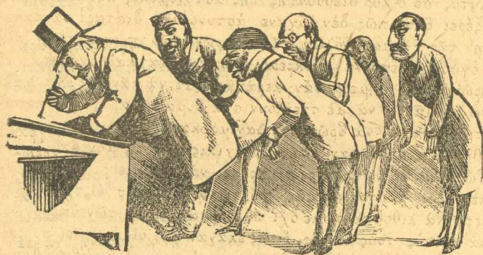
Κύρ Καλλιγᾶ, νὰ μὴ μᾶς φᾶς στὴ μερασιά.

Ἐγὼ, ἀπὸ τὸν καιρὸ ποῦ τῆς ἐρχα— δανεικᾶς —καὶ τὰς ὁποίας χρεωστῶ διὰ συνάλαγμα νὰ τῆς ἐπιστρέψω πίσω μὲ τὸν τόκο—εἴκοσι τῆς ἑκατὸ—ἔμα εἶδα πῶς ἔπερτε ξύλο, ἔγινε σκοπιδοχορτο. Ἄφαντος. Ὅλη αὐτὴ ἡ κουβέντα ἔγινε, γιὰ νὰ σὰς πῶ, ἔσας κύριοι τακτικᾶ μὲ τὸ μῆνα ἀγοραστὰ τῶν ἐφημερίδων, ὅτι δὲν εἶνε τῆς δικαιοσύνης νὰ περνᾶτε στὰ παιδιὰ τὴ δεκάρα γιὰ ἔντεκα λεπτὰ. Αὐτὰ τὰ φτωχὰ τρέχουν μέσα στὸ ἥλιο, μέσ' τὰ χιόνια, στῆς βροχαῖς γιὰ νὰ σὰς φέρουν τὰς ἐφημερίδας στὸ σπίτι σας, καὶ σεῖς θέλετε νὰ τοὺς φάτε τὸ... ἓνα λεπτὸ. Ἄδικα, καυμένοι, ἄδικα καὶ κρύα στὴ φιλοτιμίᾳ σας. Νὰ ποῦμε καὶ τοῦ φτωχοῦ τὸ δίκαιο.