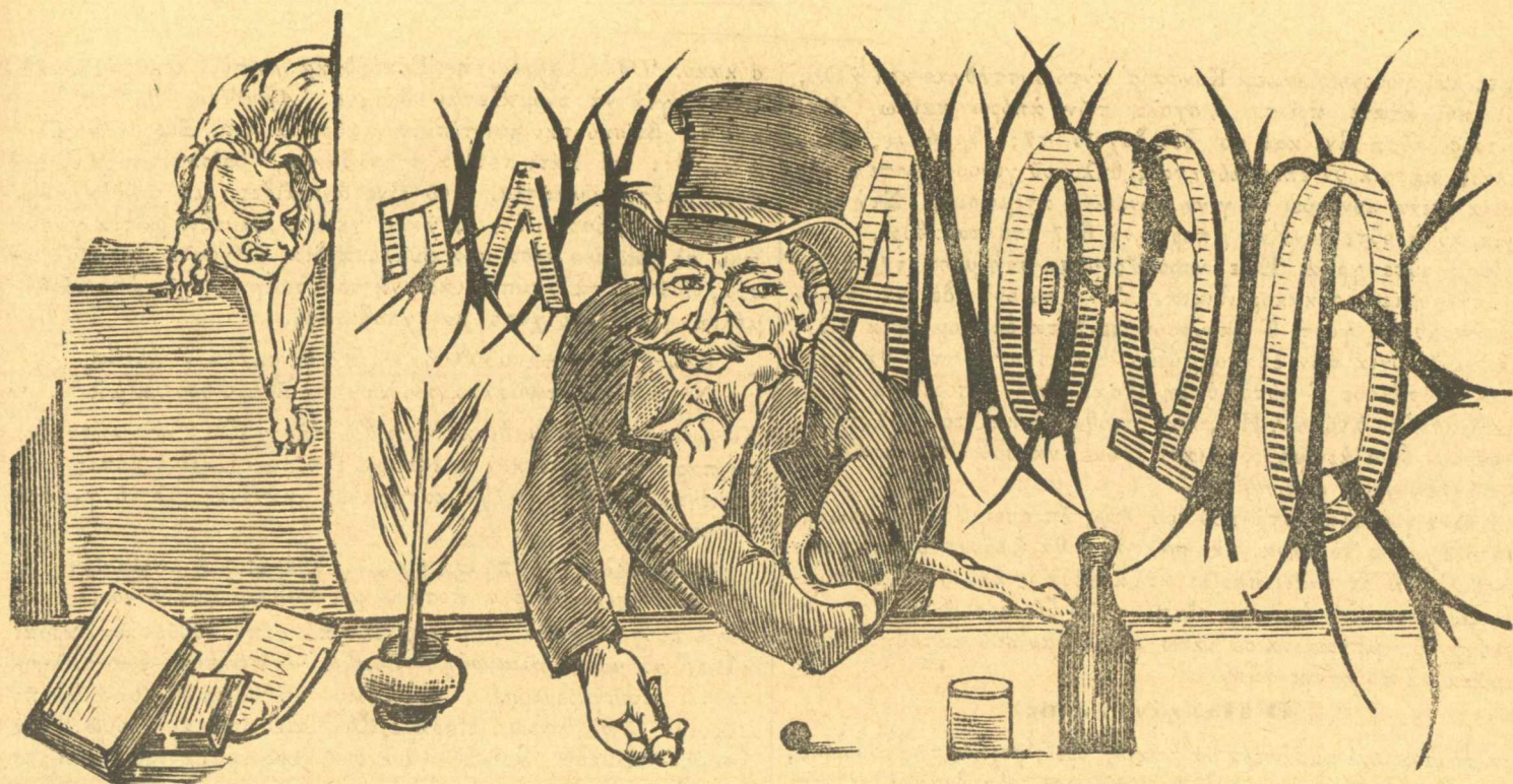
Ἡ ἀρχὴ μου εἶναι, νὰ μὴ ἔχω κάμμειαν ἀρχήν.