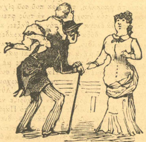
Πρῶτη ἐρωτικὴ συνέντευξις

Ἐπειδήτης εἶχα τῆ καλ.κατοῦρα φτειασμένη, αὐτῆ πού βλέπετε, σὰς λέγω, ὅτι στὴ πρώτη ἐπίσκεψις πού ἔκανε ὁ Μπαρμπαγιούκος τῆς ἀποδακτῆς του, ἕνα ἀπὸ τὰ παιδιὰ τῆς τὸν ἔκανε καθάλλα στὸ σβέρκο. Δὲν μπορῶ νὰ σὰς πῶ ψόματα, γιὰτὶ τὸ βλέπετε καὶ ζουγραφισμένο. Δὲν τὸν ἔχει καθάλλα; Αἱ;— Μὴ πῶς συνέβη αὐτό. Εἶπαμε καὶ λέμε, μεθαύριο τὰ λέμε.