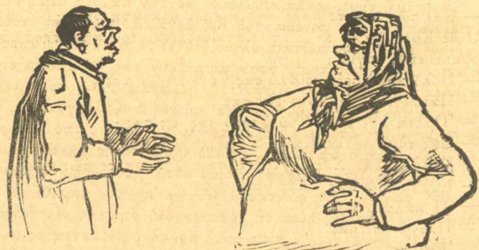
Ὁ Μπαρμπαγιούκος καὶ ἡ Κυρκινέκα κάνουν ἀργολαβία.

— Γυναίκα! Ποιὸς ξεπόρτισε τὰ παιδιὰ καὶ κλαῖν; Ὠχού. Ἦρθε ὁ ἄνθρωπος τῆς Κυρκινέκας. Τὸρα νὰ δοῦμε με-θαύριο, τί τέλος θὰ πάρουν οἱ ἔρωτες τῆς Κυρκινέκας καὶ τοῦ Μπαρμπαγιούκου, γιὰ τὸν πολὺ καιρὸ τῆ βασιλείας αὐτῆ τῆν ἱστορίαν.