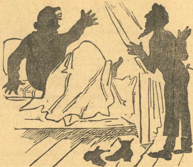
Φύγε φάντασμα τοῦ Δελφινάρη. Μοῦχο βοήθεια

στόμα μου. Μασῶ, ξερογλείφομαι, καὶ τοῦ λέω, — Βρὲ ἀδερφέ, σὺν καλὸ μοῦ φάνηκε, δὲν μοῦ δίνεις κι' ἄλλο; — Ἄ δὲν ἔχει ἄλλο. — Μὰ ἐγὼ θέλω τόρα. — Μὰ ἐγὼ πάλι ποῦ δὲν θέλω τόρα. — Καλὸ, καὶ τί ἦτανε αὐτὸ ποῦ μοῦ δώκες κι' ἔφαγα. — Χαθιάρι μαῦρο. — Μαῦρο χαθιάρι! Χριστὲ καὶ Παναῖα μου. Νὰ, ἓνα φράγκο τῶχο, καὶ δὲς μου ὅλο τὸ βραδέλι. Τῆλλα μοῦ τὰ χρωστᾶς. Μὰ δὲν εἶνε, κύριοι, αὐτὸ τὸ νέο μαῦρο χαθιάρι τῶν Κουζιδῶν πράγμα, εἶνε ἄλλο πρᾶγμα.