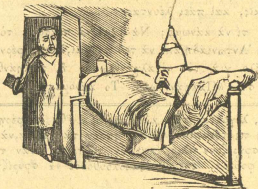
Ο Τρικούπης ξυπνά, γιά νά δώσῃ ρουσφέτι.