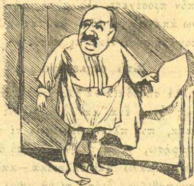
Ο Τρικούπης πάει νά κοιμηθῆ.