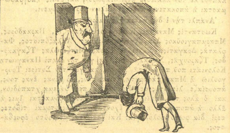
Ο Τρικούπης δίνει στο ρουσφετλή τὸ ρουσφέτι.

Τὴν ἴδια ὥρα μὲ φώναξε στὴν αὐλή καί μοῦπε μὲ σοβαροῦτης.