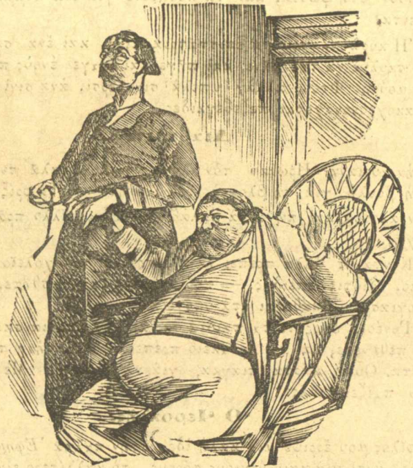
Γιατί φούσκασε ή κοιλιά μου από τό πολύ φαγή. — Τιποτα, έχεις βλογιά, βλαις ή ασθένειαίς είνε σήμερα βλογιά.