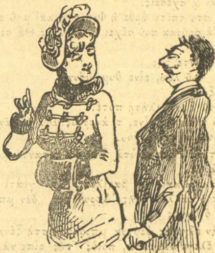
Πώς ανατρέχιασα, όταν με πρωτοκουβέρτιασε ή Έλληνική.