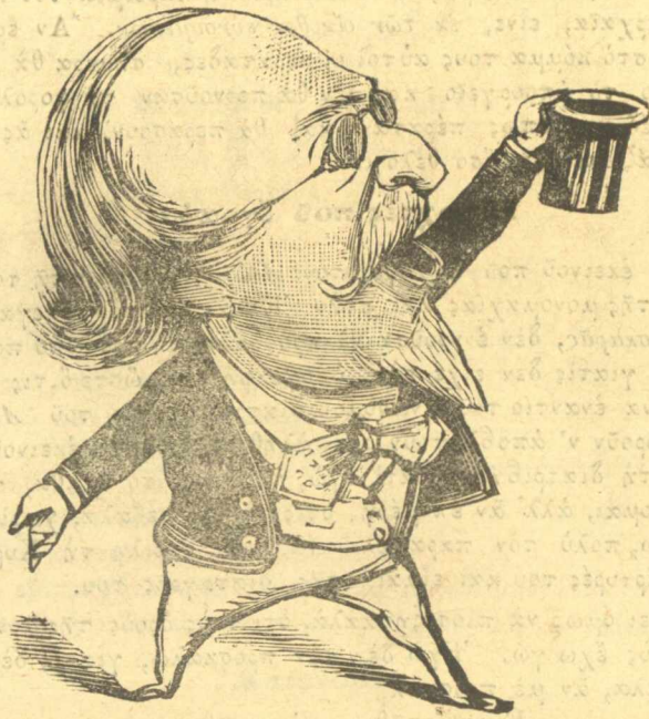
Ζήτω ὁ Τρικοῦλης, ζήτω του. Μωρὸν σὺ ἐγίνεα καὶ τζαμπά- σης... Κορδίδο, ποῦ σὲ κατάστρεψα.