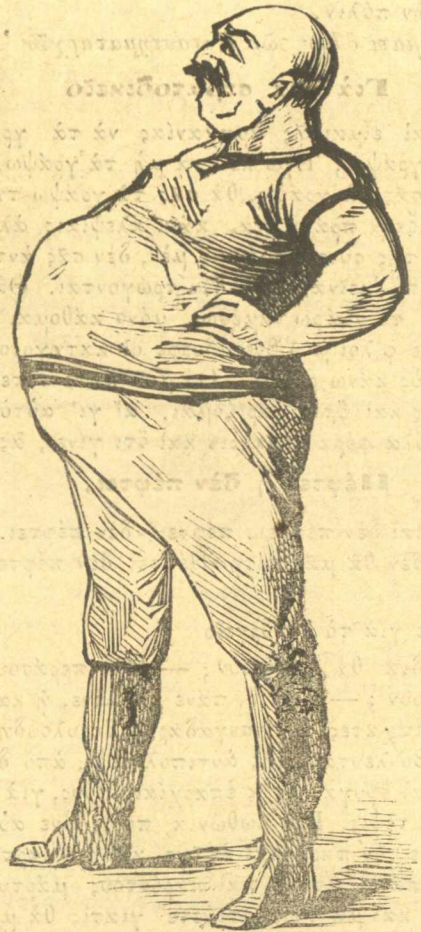
Ἐνταῦθα κείμαι! Εἶμαι καὶ γαίνομαι παλληκαρᾶς, καὶ ὅποιον ἀπὸ τοὺς ἀντιπολιτευομένους τοῦ βεσῆ, ἄς ἐρῶν γὰ πα- λέψομε.

Ὁ Μουστάρδας τᾶχασε, τρέχει ἀμέσως, στακῶνει τὸ γάτο του, τὸν παρουσιάζει στῆ Μαργέτα καὶ λέει;