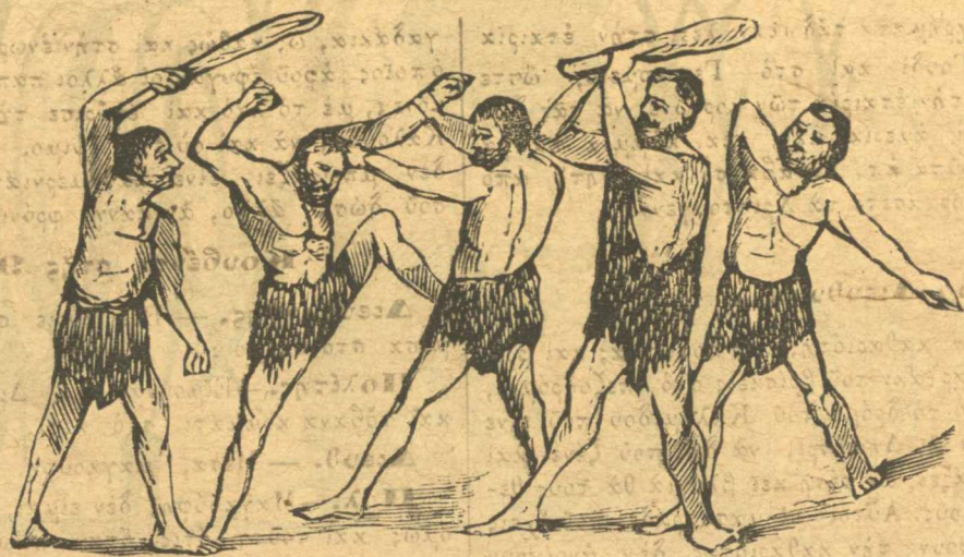
Παίζουν τὰ ρόμπλα στὴ βουλή.