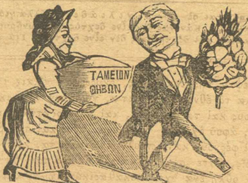
Δῶρα τοῦ Τρικουπή πρὸς τὸν Βελέντζη.

Γαρακαλιῦνται οἱ Κοι Ἀδελφοὶ Βούτζη νὰ ἐγχειρίσουν