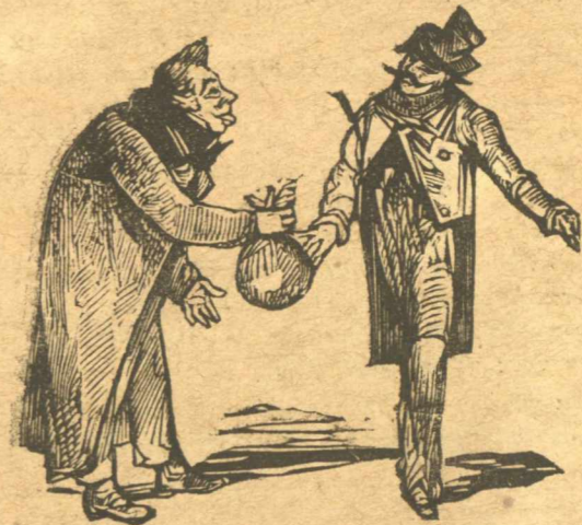
Κύριε ένορκε, για τον Βελέντζα τα όλίγα αυτά.

— Έγώ να δεχθώ χρήματις; Ποτέ! Άλλά για περιέργεια, φράγκα είναι ή δεκάρας;