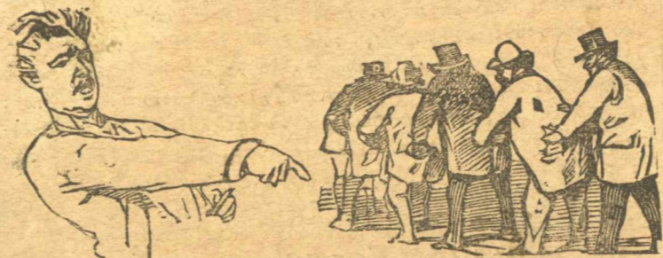
Ίδου ή τιμότης των δημοσίων υπαλλήλων.