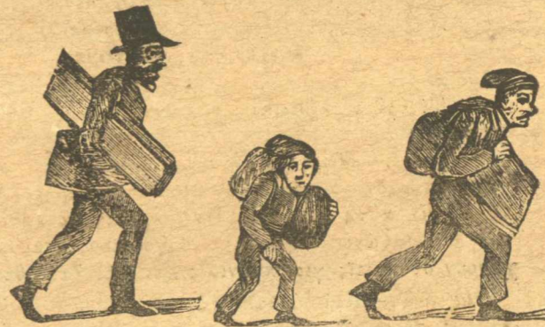
Νυχτοκλέφτες κουβαλώντες τον καρπό τής εργασίας των.