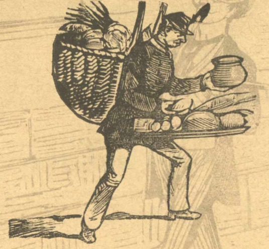
Τύπος 'Ελληνα στρατιώτου ὑπηρετοῦ.

νεται καὶ στὰ χάρφια, μεταξύ τῶν ἐργατῶν καὶ τοῦ Κουμπάρη τοῦ θεοτρέλου, ποῦ πήγε καὶ φορτόθηκε τῶν ἀνθρώπων στὰ καλὰ καθουμένα, καὶ σὰς τὴ γράφει, ὄχι γιὰ τὴν ἀξίει τὸ κόπο, ἀλλὰ γιὰ νὰ ξέρετε, ὅτι στὴν Ἀθήνα, κοντὰ στὸν κόντε ντὲ Καστρο, στὸν πρίγκηπα Ἀθερινόπουλο ἔχομε καὶ τρίτο κελεπούρι θεοτρέλου, τὸ δούξ Κουμπάρη, τὸν ὅποιον σὰς παραδίνω ἀπὸ σήμερα γιὰ νὰ τὸν ἀποζουρλάνετε. Θὰ ἐκτεθῇ καὶ Δήμητρως, ὅπως ἄλλοτε βουλευτῆς. Πολλοὶ τρελλοὶ μὰς φορτόθηκαν καὶ ὁ Θεὸς νὰ μὰς φιλάῃ.