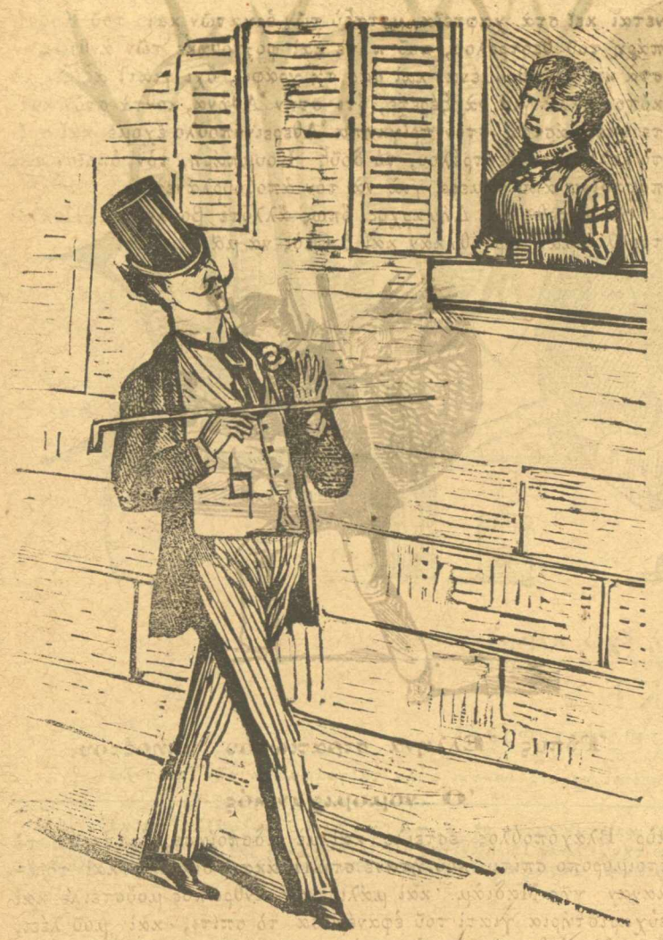
Τύπος 'Αθηναϊκού' εργολάβου.

Θά βρᾶνουν στή βουλή δυναμίτις. Αὐτὰ τὰ κουρουφέζαλα ἂν ἦτανε πρωταπριλιά θά τραγώτανε λιγάκι, ἀλλὰ τώρα