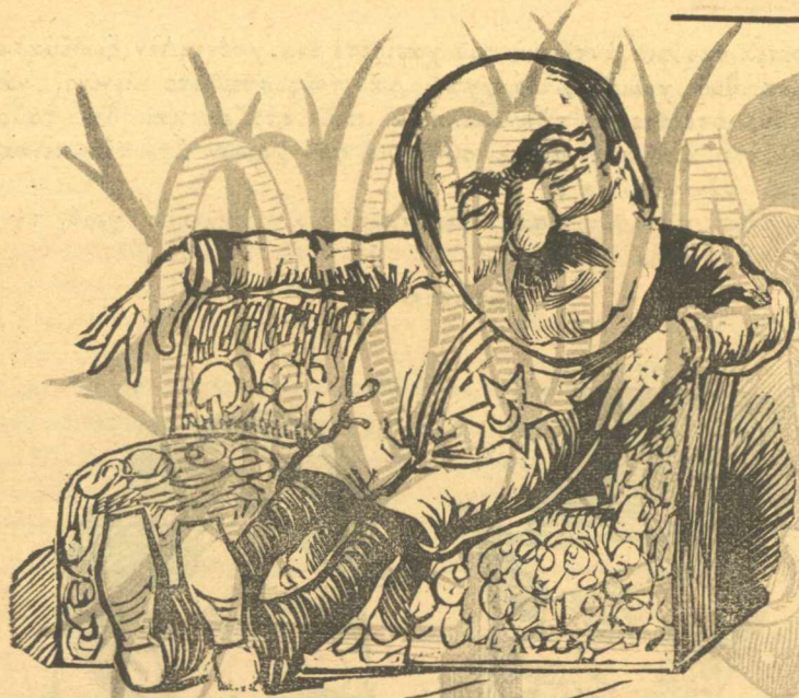
Κοιμάται γιατί πήρε το παράσημο