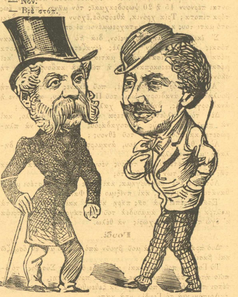
Βρὲ μουσιμάγκα Ράλλη, ἐγὼ εἶμαι ὁ μέλλων προθυπουργός.