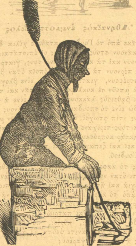
Ὁ Βουρκόλακας τοῦ Γουδίου.