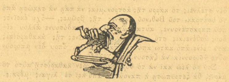
Ποιὸς τάχα γὰρ αὐτὸς ποῦφαγε ὁ Τρικούπη

Ἄει στὸ διάβολο και σὺ κοπρίτη, και κρῖμα ποῦ διδάσκεις και τὸ εὐγενέστερο μάθημα τῆς μουζικῆς.