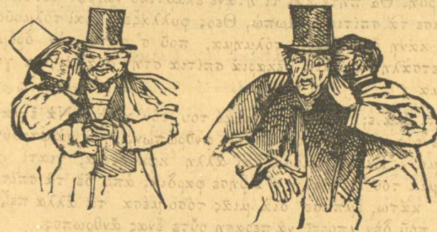
Μυστικὸ. Θὰ τὸν ἀθώωσουν πάλι τὸν Βελέρτζα

Ὅρα μὲς τὴν ἀναμάρφωσι σου, Τρικούπη. Δὲν ντραπήκες γιὰ ἕνα Πετσάλη νὰ καταστρέψῃς τόσους νοικοκυρούς και καταστηματαρχας; Ἐσίνα δὲν πρέπει νὰ σὲ πνίξῃ κᾶνεὶς, ἀλλὰ πρέπει νὰ πιάσωμε ὄλο τὸ Κεφαλάρι και νὰ στ' ἀδιά- σωμε ὄλο μ' ὄλα του τὰ βαγτηρίδια μὲς τὴ κοιλιὰ σου νὰ σὲ φᾶν ζωντανὸ νὰ πᾶς στὸ διάβολο, διόντρου κουλεῦκι.