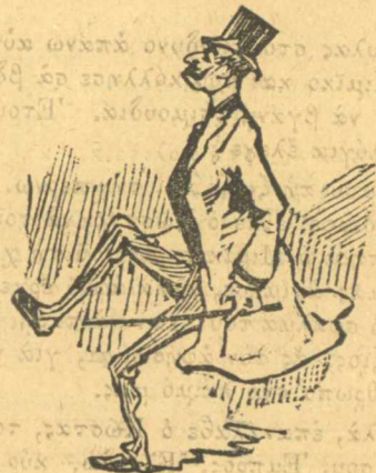
Πῶς ρίχτηκε ὁ Κώστας τοῦ Μπούρμπουλα.

Ὁ Περαματοῦλά μου ὠρᾶ, ψυχορογᾶς κι' ἐκπνέεις, ὁ τίγρης τοῦτος Μπούρμπουλας, σ' ἀτίμα μὴ κλέεις.