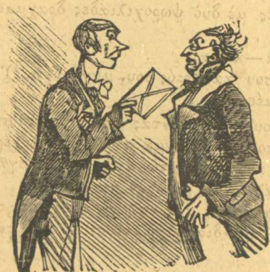
Ἡ ἐξόφλησις τοῦ συνάλλαγμα.

— Στάσου, ἀδερφέ, ἄς κάνουμε μιὰ μικρὴ ἀναχωρῆ πολέ-