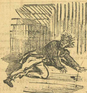
Μεθυσμένος γεωμετροῦ τὸ δρόμο.

σης. Ἐδῶ εἶνε φρίκη, ἐδῶ Θεέ μου, πού με ἔρριξες ἐδῶ μέσα σέ τοῦτο τὸ σπίτι, δὲν με ἔρριχνες καλλίτερα στή κόλασι τοῦ ἄδην, στὰ τάρταρα τῶν ἐγκάτων τῆς γῆς, δὲν με ἔρριχνες ἐκεῖ πού ψίνει ὁ ἥλιος τὸ ψωμί κι ὁ ἄνεμος τὴ πῆττα, ἀλ- λά μέρριξες ἐδῶ, πού πάω νά χάζω τὸ κεφάλι μου. Προγα- μηαῖα δωρεά; Καὶ πού τὰ βοήκη γώ τόσα λεπτά νά κάνω καὶ προγαμηαῖα χαρίσματα; Ἐγὼ εἶμι ἀνθρωπος πού καὶ ὁ Θεός ξέρει πῶς ἀγωνίζομαι γιὰ νά βγάλω τὸ καρβέλι τῆς ἡμέρας μου. Τί εἶμι ἐγὼ, κἀννένας Τσιγγρός ἢ κἀννένας Σίνας νά χα- ρίζω με τὴ χεῦφτα τῆς χιλιάδες ἐδώθες καὶ ἐκεῖθες;