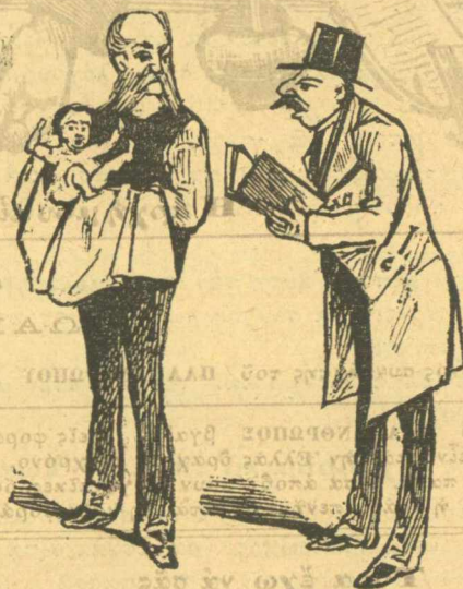
Σοῦ παρουσιάσω τὸ νεογένητο μωρὸ Τρίτο κόμμα