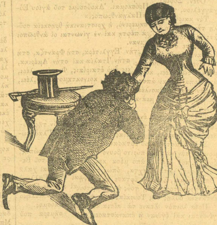
Ὁ Μπούρμπουλας φιλεῖ τὸ χέρι τῆς Περμαθούλας