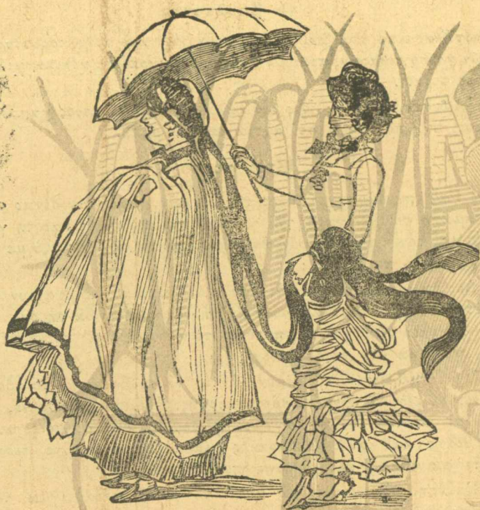
Νέα μόδα. Ἡ κυρά νά κάνη τή κουδερνάντα στη κουδερνάντα.