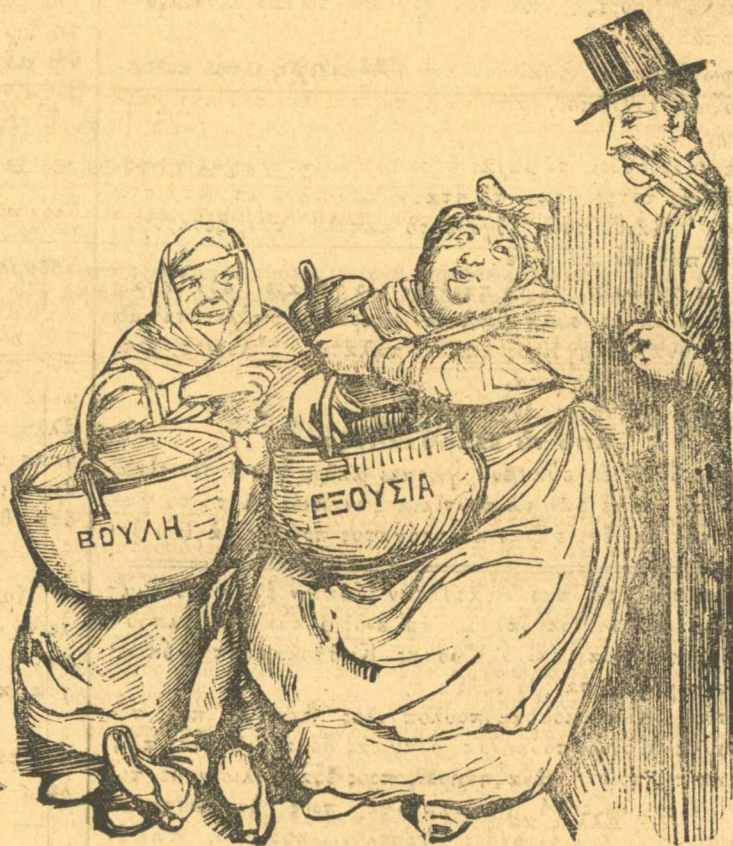
Θὰ σᾶς πάρω καὶ τῆς δυό.

Μεθαύριο θὰ δῆτε τι νέα μαρτύρια ἐτράβηξε μὲ τὴν Περ- μαθούλα ὁ Μπούμπουλας; γι' αὐτὸ τὸ πολυπαθῆ του καπέλο.