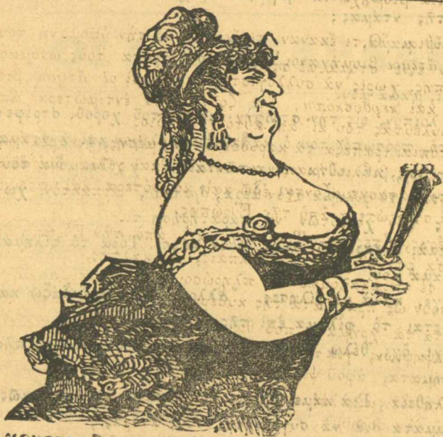
Ἡ χρυσαγαθάρενα Νενίτσα. ἔτοιμη γιά τὸ χορὸ.

Αυτή η μικρούτσιχη δὲ κλεψίτσα ἐκούστισε γιά ἐργατικὰ κάμμιὰ διακοσιὰ δραχμῆς και κάμμιὰ τετρακοσιὰ τὸ χαρτί, διότι κι' αὐτὸ τὸ φόρτωσε στή καμπούρα τῶν δημο- σίου.