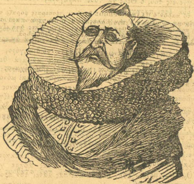
Ὁ πρῶτος μασκαράς τῆς Ἑλλάς, ὁ διαβόητος Καλιγούλας.

Ἰππεγε ὀπισθὲ μου και σὺ σαταναδενᾶ, ἡ καλλίτερα εἶλα ἀπὸ μπρός μου. Μὰ τὸ Θεὸ, ἔτσι κανουν κάμμιὰ φορὰ αὐταῖς ἡ γυναῖκες ἐμᾶς τοὺς ἀντρας νὰ θυμῶνουμε και νὰ μὴ ἔε- ρωμε τί λέμε.