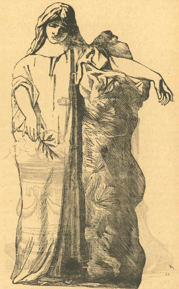
Ἡ Μάνα τοῦ Γέρου, ἡ Ἑλλάδα.

Ἄν σε ρωτήσῃ ὁ Ἀσώπιος, ὁ Βάμβας, ὁ Οἰκονόμου καὶ οἱ ἄλλοι σοφοὶ μας πῶς προκόψομε στὰ γράμματα; μὴ τοὺς πῆς, ὅτι ἀπὸ τὰ πολλὰ γράμματα καταντήσαμε ὅλοι ἀγράμματοι, ὅλοι σοφοὶ χωρὶς νὰ ξέρομε τίποτα.