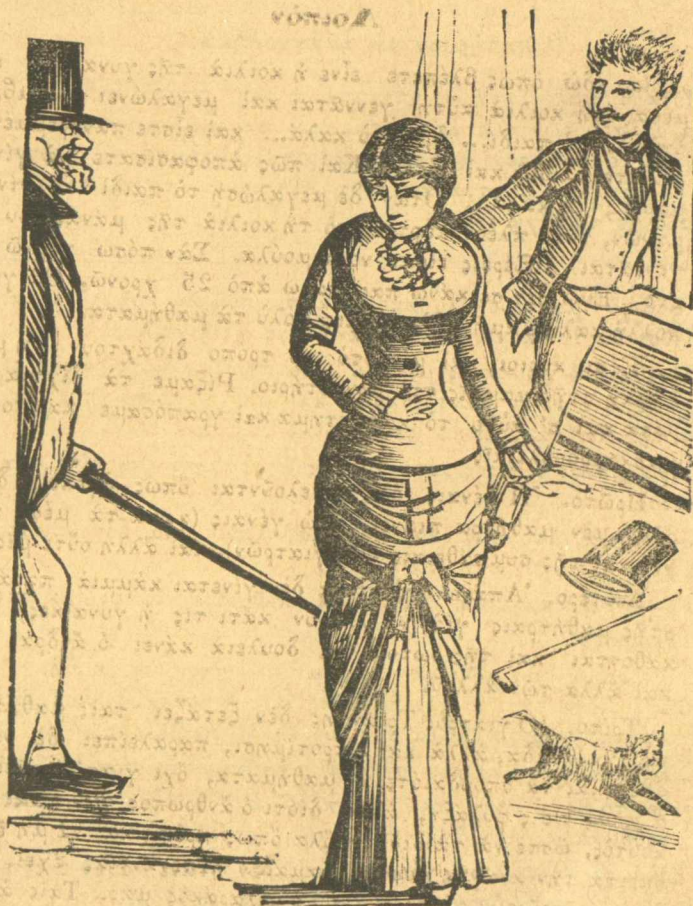
Ἐφοδος τοῦ πατέρα τῆς Νινίτσας