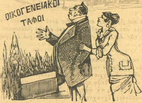
Σημερινός σηηνός στο Νεκροταφείο.

Έδώ, άνδρα μου, είς οι οικογενειακοί μας τάφοι. —Γί λες, γυναίκα, με πέθανες ζωταρό;