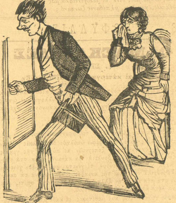
Ό Γαϊδουριάδης φεύγει θυμωμένος από τ'ή Νινίτσα του.

Μωρέ χ'άθηκε, άντίχριστοι, ένν ψωροδεκάριο να δώσετε σε ένν κ'άρρο να πάη να θ'άψη τό φτωχό απόμαχο, που έφαγε τ'ή ζωή του ύπηρετώντας τ'ή πατρίδα; Νά πληρώνετε τ'ής ζηντάρες διατηρώντες έχταχτους κλητόρους, κηφ'ηνας, που δεν πατούν ποτέ τό ποδάρι τους στην άστυνομία, έχετε λεφτά,