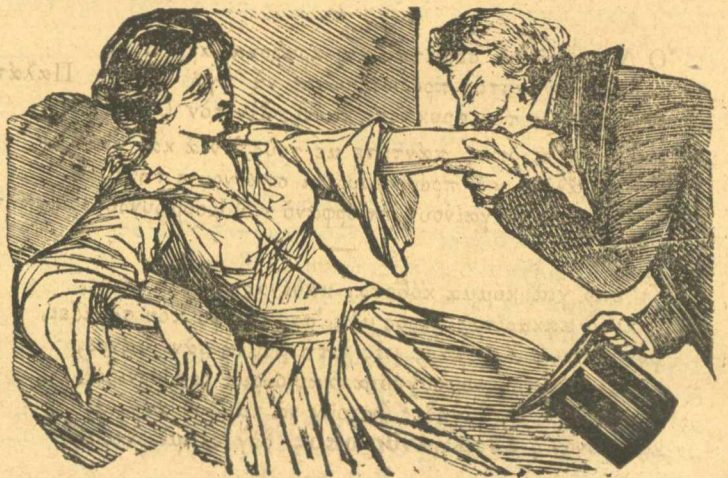
Ἡ Γαῖδουριάδης γι' αὐτὸ τὸ γέμι τῆς Νινίτσας.

Μὴ ρωτᾶτε, εἶνε' τροχικὰ καὶ γι' αὐτὸ σὲς τὰ λέω μεθ' ἑαυτοῦ γιὰ νὰ τὰ θυμηθῶ καλλιτέρα.