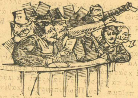
Πῶς κάνουν οἱ καπνοπώλιδες στὴ βουλῆ, ἔταρ ψηφίσθη τὸ νομοσχέδιο.