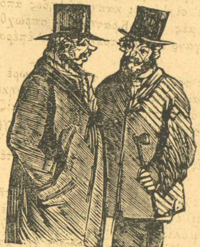
Και τίρα τί θὰ κάνουμε, θὰ τὸν κόψουμε τὸν καπνὸ; — Θὰ τὸν κόψουμε σύριζα.