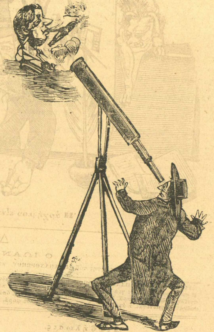
Ὁ διάβολε, αὐτὸς ποῦ φομαῖε κιὲ πάνω θὰ ἦναι χάρερας Θεός.