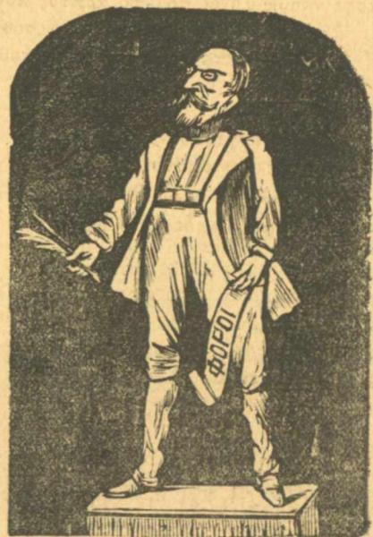
Ἄγαλμα Καλλιῆ μετὰ θάνατο.

Μ' αὐταῖς τῆς πέρλαις κοντεύω νὰ γίνω καὶ Αὐτοκράτορας τοῦ Μαρόκου.