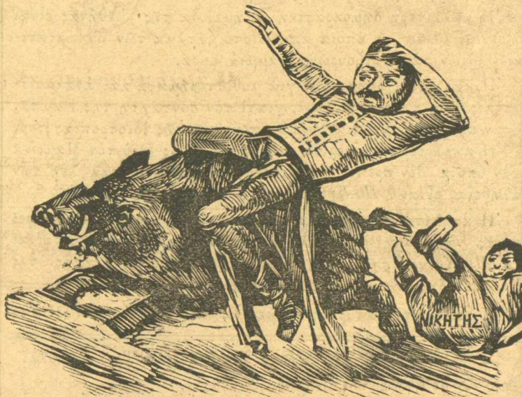
Γουρουνοδρομία σημερινὰ Φαλήρου, ὁ πρῶτος νικητὴς πέρνει τὸ βραβεῖο κεῖ ποῦ τὸ βλέπετε.

Ἄς τὸν δόσουν καὶ τότε νὰ τοὺς βγάλω κ' ἐγὼ τὴ σκούφιαν μου καὶ νὰ τοὺς πῶ = μετάνοια, Δέσποτα. Καὶ κάτι ἄλλο ἤθελα νὰ πῶ, ἄς πᾶει, δὲν πειράζει.