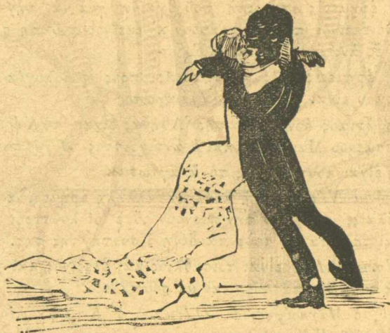
Μπουκέτο γιὰ τὴν ἔκθεσιν τῶν ἀνθέων

Ἐνα κορίτσι χονδροπαλάδικον μούκλεψε ἕνα παῖδά τούρκικον, καὶ ἔστοντας μετὰ τὸ νὰ κάνω συλλογὴ νομισμάτων τὸ παρακαλῶ νὰ μοῦ τὸν δώσῃ, ἀλλοιῶς θὰ τὸ περάσω στὸ Παλιάρθρωπο, μ' ὄλη τὴ συγγένεια ποῦχομε. Ἄμ αὐτὸ πλέον δὲν ὑποφέρεται.