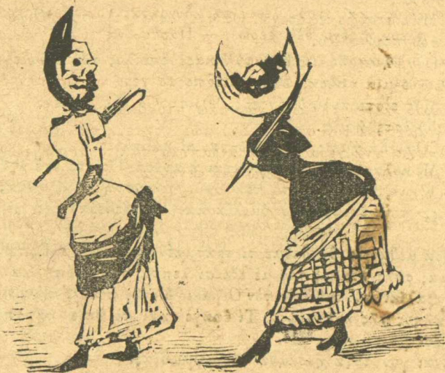
Ἀθήνη γιὰ τὴν ἔκθεσιν τῶν ἀνθέων.