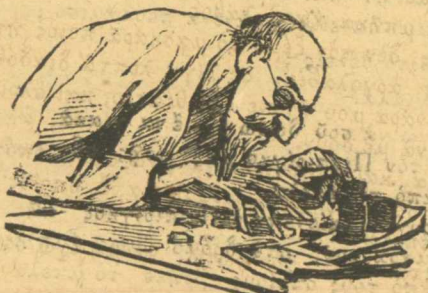
Μετρά τὰ κέρδη τῆς κλεψιάς

κύρ διευθυντή, μὲ τί δικαίωμα δικαιώματος κατοικᾷ μέσα στὸ "Έχτο τμήμα ὁ ἀρχικλήτορας Κονοφάγος; Πλερώνει ἄραγες τὸ δημόσιο καὶ τῆς ἰδιαίτερας κακοικίας τῶν κλητόρων; "Έπειτα οἱ κλήτορες αὐτοῦ τοῦ τμήμα, πᾶν οἱ ἄνθρω-