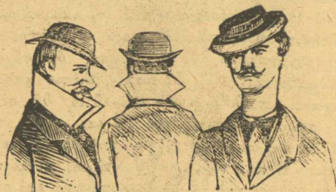
Μόδα ἀ.λ.α γιὰ τὴ Τρικούπη