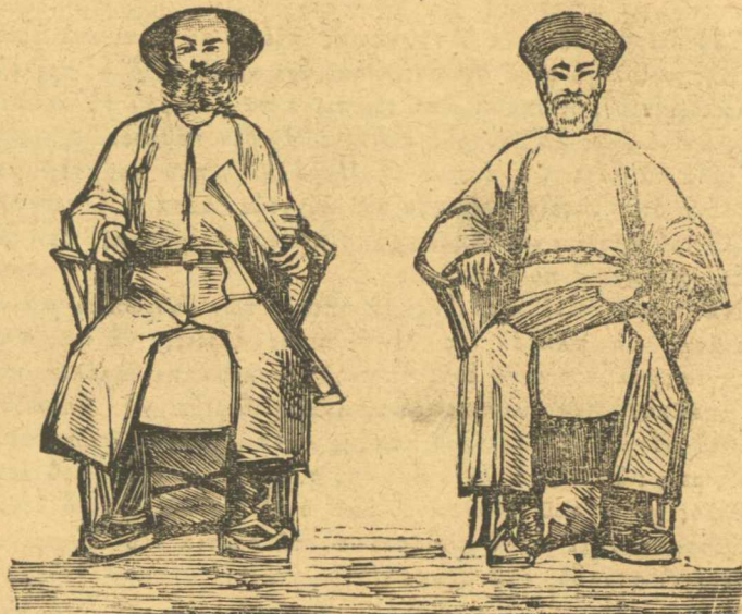
Οἱ δύο ἀρχιμανδάρηνοι τῆς Ἑλλάδος.