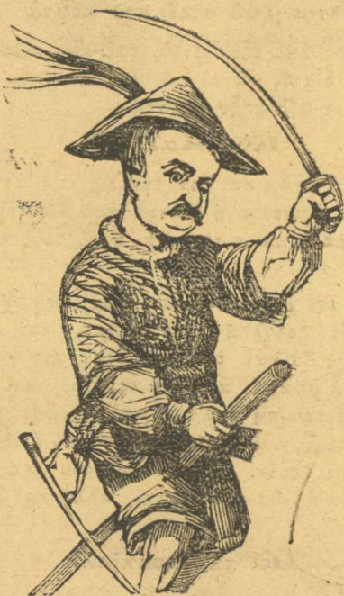
Ὁ ὑπουργὸς τῶν στρατιωτικῶν πᾶσι νὰ πάρῃ τὴ Μπόλι.

Τί τῆς φυλάτε τῆς χιλιάδες γιὰ νὰ κάνετε τράπεζα; Κάνετε μωρὲ ἓνα καλὸ νὰ συχωρευθῶν, τὰ πεθαμμένα σας, κάνετε καὶ μᾶς φάγαν οἱ βούργαροι.