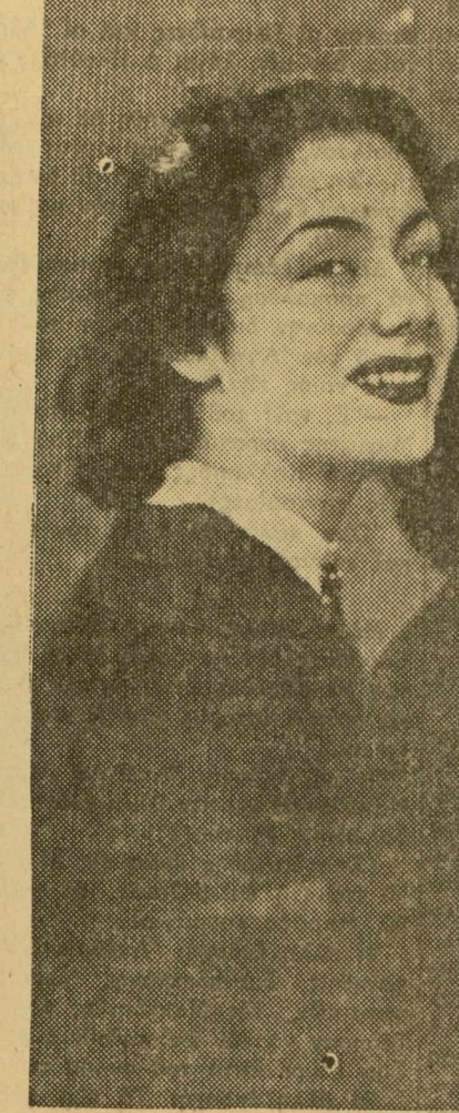
Οί αδερφές Μπελλίνοι