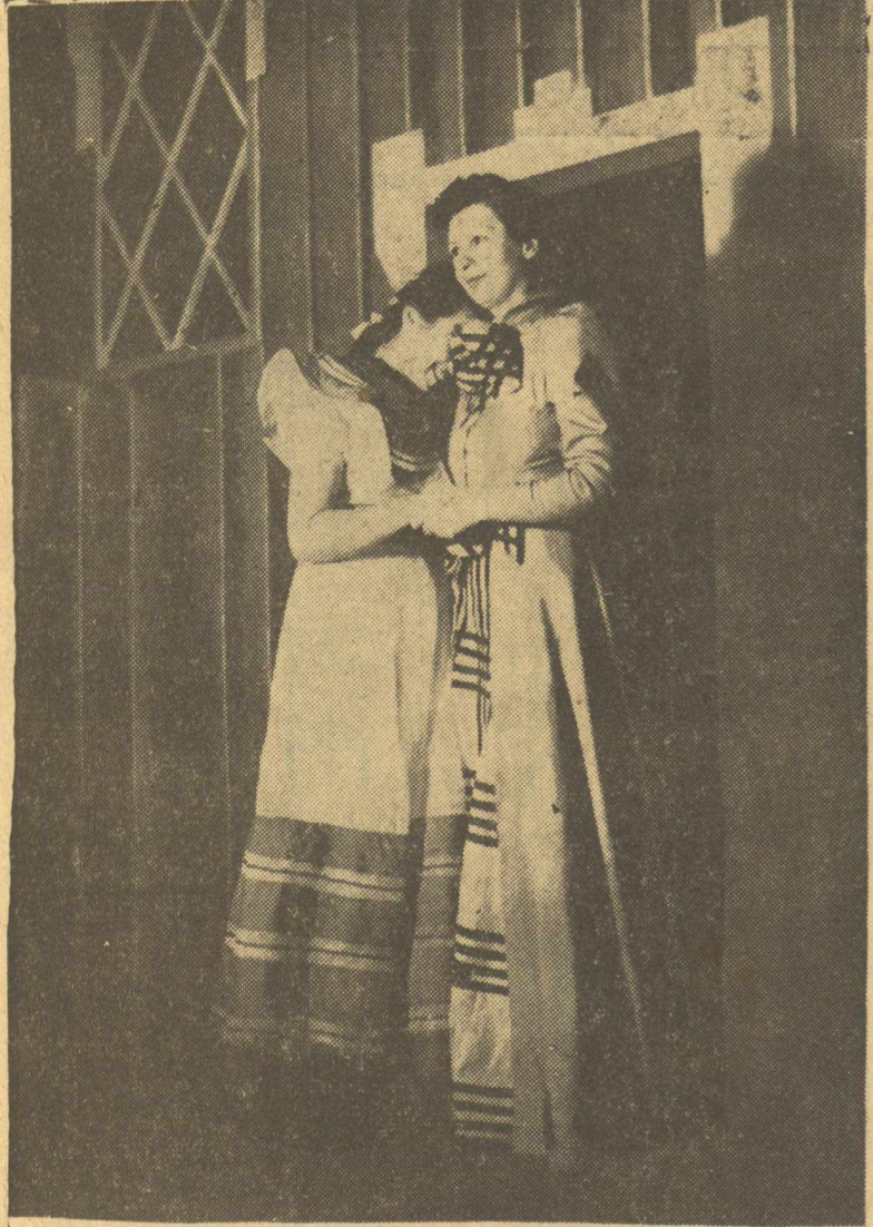
Η κ. Κ. 'Ανδρεάδη ως 'Κυρά τής θάλασσας' και ή δίσ Λεκκού ως Χιλντα.