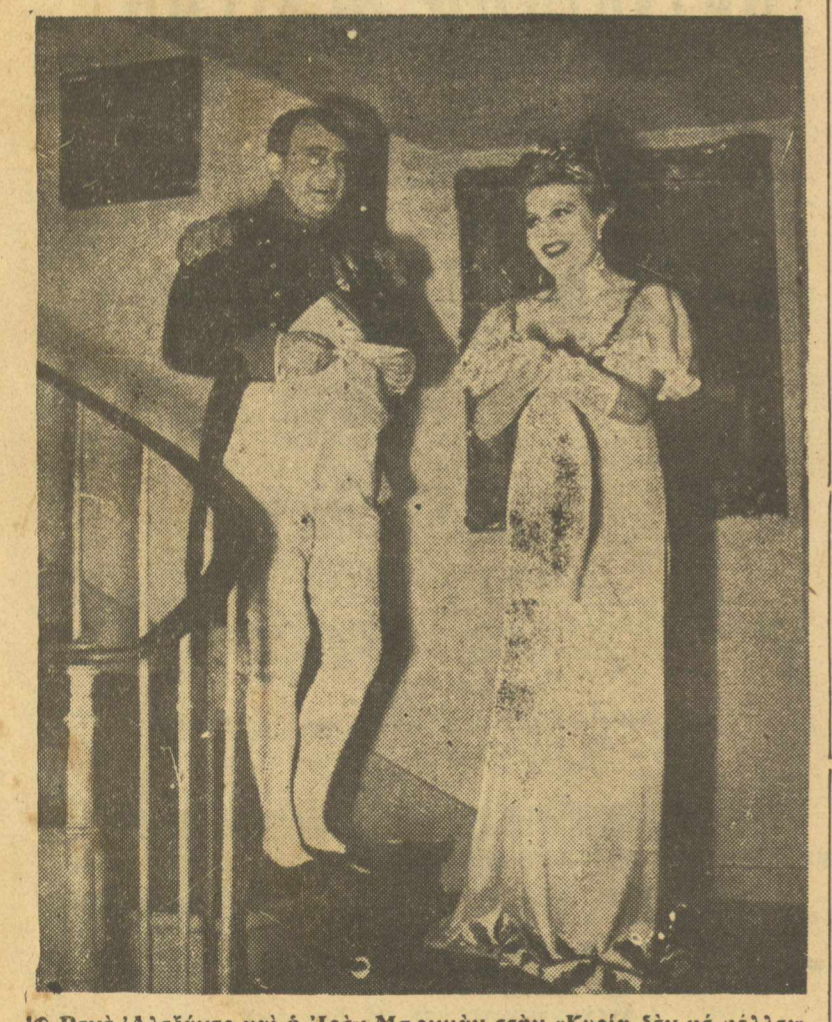
Ο Ρενέ Ἀλεξάντρ καὶ ἡ Ἴρὲν Μπριγιάν στὴν «Κυρία δὲν με μέλλει»

Ἐάν οἱ φανταστικῶς τῆς Μονιάρτης, ἀποδίδουσι εἰς τὴν ἀειθαλῆ καλλιτέχνιδαν κ. Σεσίλ Σορέλ — τὴν