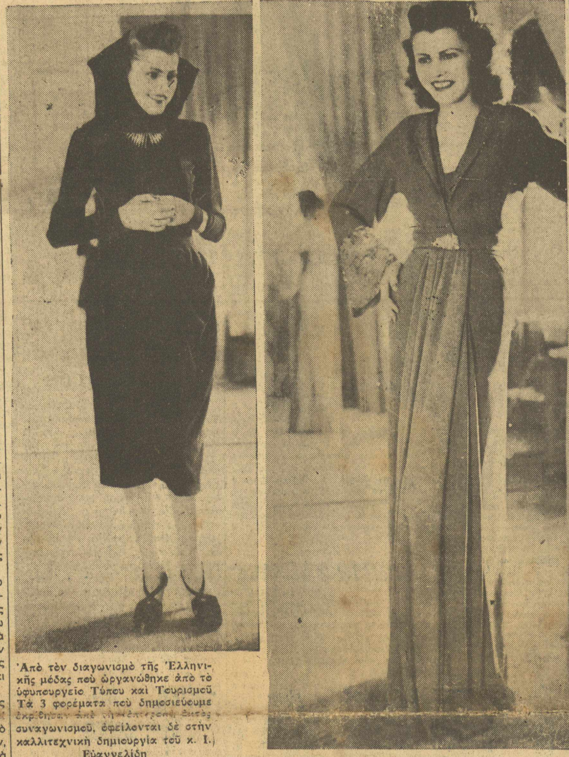
Ἀπὸ τὸν διαγωνισμό τῆς Ἑλληνικῆς Μόδας ποῦ ὄργανώθηκε ἀπὸ τὸ ὄργανο τῆς Τέχνης καὶ Τεχνουργίας. Τὰ 3 φορέματα ποῦ δημιουργήθηκαν ἀπὸ τὸν ἀρχαῖο ἀνάγλυφο τῆς Ἐλεκτρας ἀπὸ τὸν καλλιτεχνικὸν δημιουργοῦ τοῦ κ. Ι. Ἐυαγγελίου.