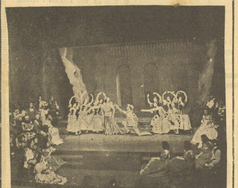
Μία σκηνή από την Β' πράξη των «Δημιουργηθέντων συμφερόντων»

Έπιτέλους το πνευματικό μας έπιπεδο ανέθηκε μερικές γραμμές. Να πού φτάσαμε στον Ουάιλντ και μενουμε έκει σταθερά. Τόσος Ουάιλντ στα έπίσημά