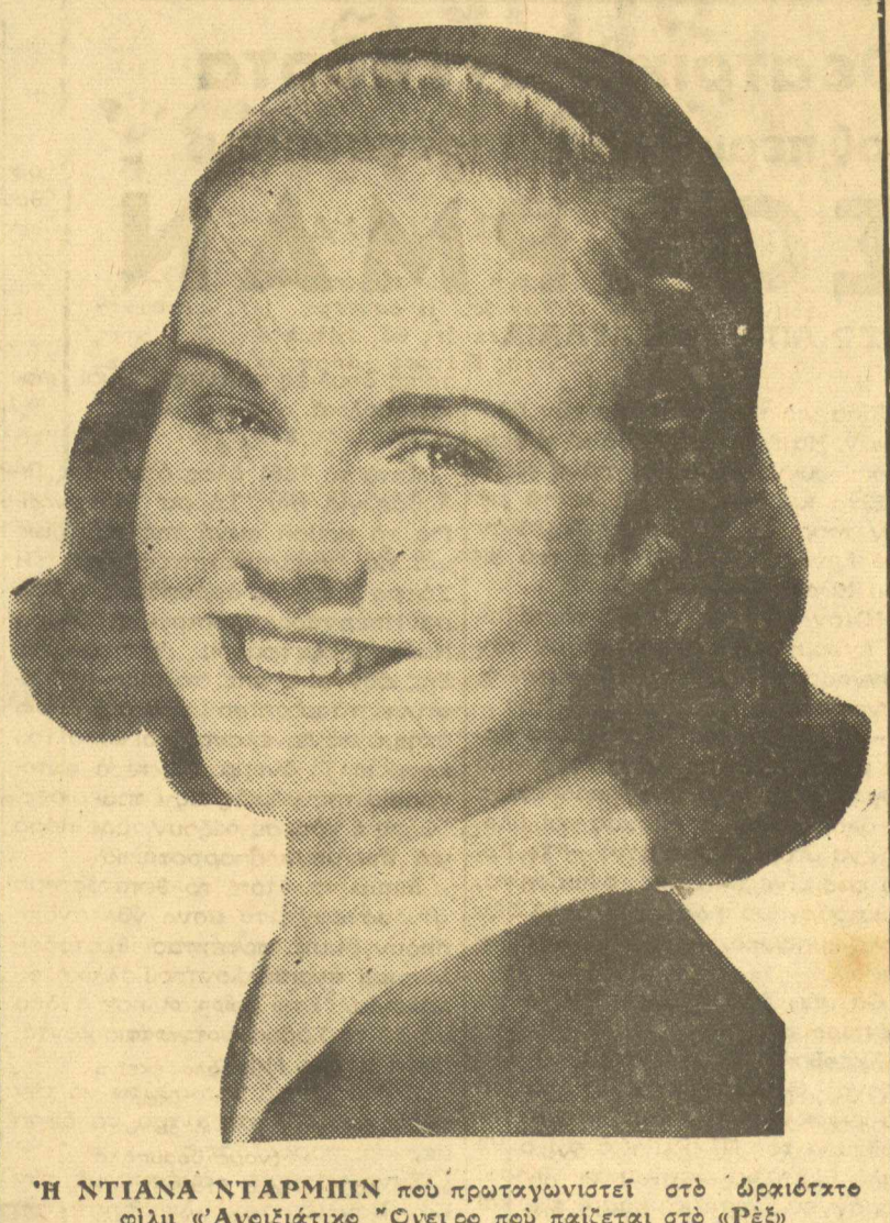
Η ΝΤΙΑΝΑ ΝΤΑΡΜΠΗΝ που πρωταγωνιστεί στο άρκετάκι φιλμ "Ανεξιτήτικο" Ούτε πορ παίζεται στο "Ρέζ"