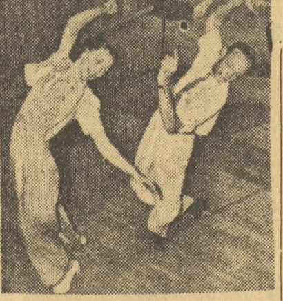
Η «Ελινορ Πάουελ και ο Φρέντ Άσταϊρ στής «Μελωδίες τού Μπροντενγκάιν τού 1940»

Η «Ελινορ Πάουελ γιά μιά φορά στής «Μελωδίες τού Μπροντενγκάιν τού 40» δέν παρειαζέται πιά τή νέα κοπέλλα τή χαμένη μέσα σε μιά μικρή πέλη, πού πρεσυναζει να