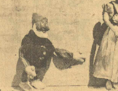
Ίονάθ' ο «Ητροπαλιού και τού ελο- φάκι. Τρεις από τούς... πρωτυμνιστές ού πρώτου έργου πού θά παιχθ' σ' τού θεάτρο τών ζωντανών κούκλων.