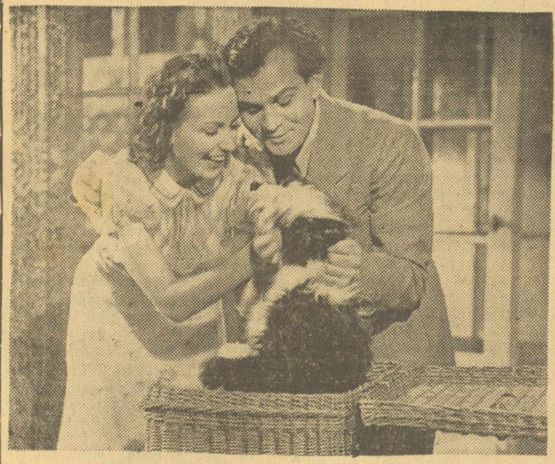
Μία σκηνὴ ἀπὸ τὴν ταινία ὁ «ΠΡΑΣΙΝΟΣ ΑΥΤΟΚΡΑΤΩΡ» ποῦ θὰ παιχθῇ τὴν ἐρχομένην ἑβδομάδα στὴ «ΤΙΤΑΝΙΑ» καὶ ποῦ ἔχει πρωταγωνιστὲς τοὺς ΓΚΟΥΣΤΑΒ ΝΤΗΣΛ—ΚΑΡΟΛΑ ΔΕΟ-ΡΕΝΕ ΝΤΕΛΙΓΚΤΥ

Γκλόρια ἐπεβλήθη, ἄρχισε νὰ τὰ ξοδεύῃ ὅλα. Χωρὶς νὰ ὑπογράψῃ καινούργιο συμβόλαιον, ἀποφάσισε γιὰ ἕνα χρόνον νὰ μείνῃ ἐλεύθερη. Ἐπειτα ἐναγύρισε στὸ Χόλλυγουντ καὶ μετ' τὴν ἐκπληξὴ δλονῶν ἄρχισε νὰ διευθύνῃ τὴν δική της εἰσαγὰ παραγωγῆς. ΜΙΑ ΠΑΙΧΤΡΑ Μὲ τὸν καιρὸ νὰ εἰσβολὰ ἐπέβη θῆκε καὶ ἡ ἑξ ἰσού δημοφιλία της στὴν «Βροχὴ» δὲν ἴτανε παρά μιά μέση ἐπιτυχία. Πῆρε τὸν «Ἐρικ φὸν Στρογγάμι» γιὰ ν' ἀνεβάσῃ στὸ θέατρο τὴν «Βασίλισσα Κέλιν» ἀλλὰ στὸ τέλος μαλώσανε καὶ ἔμεινε ἀτέλειωτὴ αὐτὴ ἡ ταινία.