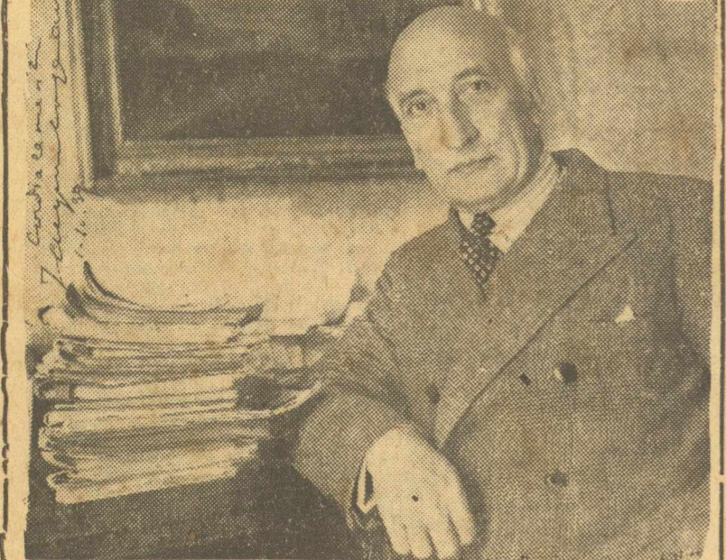
'Ο Ζακ Κοπώ που άφιερώνει τη φωτογραφία του στη συνεργάτιδα μας Ι. Σκαραβαΐου.

λος σκηνοθέτης - ήθοποιός, ο πιο μορφωμένος, ο άνοτότερος, ο πλέον ένδοξοσ καλλιτέχνης του γαλλικού θεάτρου. 'Ο Κοπώ, υπηρέτει άκόμη σήμερα, ως πρώτος σκηνοθέτης της Κομεντί Φρανσαΐ, ως θε