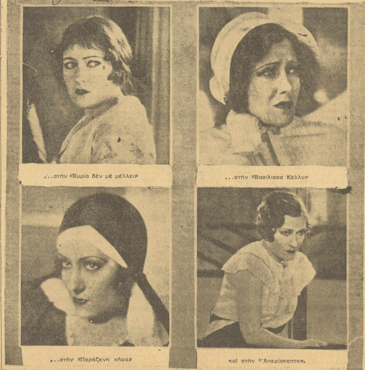
...στὴν «Κυρία δὲν με μελλεῖ» ...στὴν «Βασίλισσα Κέλλιν» ...στὴν «Παράξενη χῆρα» καὶ στὴν «Ἀπερίκεπτος»