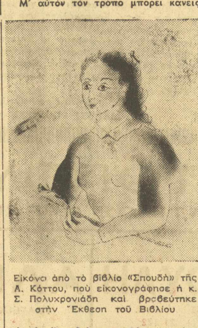
Εικόνα από το βιβλίο «Σπουδή» της Α. Κέττου, που εικονογράφησε ή Κ. Σ. Πολυχρονιάδης και βρεθείτικη στην Έκθεση του Βιβλίου

«Το έργο της τέχνης δεν είνε μόνο ένα κατασκευασμα. Το κάθε θέλει να χη ένα οργανικό σύνολο. Έναν αυτόνομο όργανο που να ζη μόνο του. Όταν λείπει αυτό τότες γίνεται άψυχο και κρύο. Κι' αυτό όχι μονάχα στην έχτέλεση μα και στην θεωρήση. Νά το βλέπουμε σαν ζωντανό θεατής άλλο ζωντανό πράγμα, έμβασίνοντας όσο παίρνει ύποση να δρούμε μέσα του την πνοή του που το δημιουργήσε».