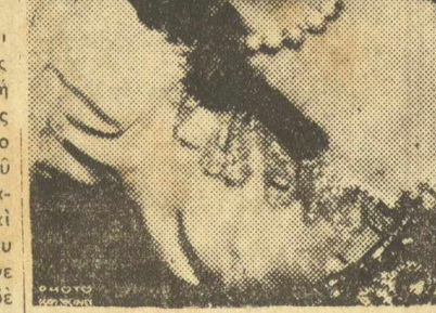
Η Σεσίλ Σορέλ σ' ένα ιστορικό ρόλο της

Η αναγνώριση αυτή — αναγνώριση γενική — δυστυχώς δεν ίαχαι και για τις άφρονες παστάσεις καινοτομίες που σπερίει από καιρού εις καιρόν η Σεσίλ Σορέλ στο Παρισινό κείνο, όπως π. χ. ένα πρόσφατο σκίσι της παρμένο από το 'Ημέρομα της στριγκλάς», του Σαίξπηρ, το οποίο σκέτι η Σορέλ άνεβάσει στο ρεβύ της 'Αλαμπρας και φηγογράφει σ' αυτό με Νέγρους και γυνες χορευτήρες. Άλλά, το λάθη είναι για τους ανθρώπους. Άνθρώποι δε σαν τη Σεσίλ Σορέλ, έχουν δικαιοσύνη όχι σε έπείκεια μα κάποτε και σε θαυμασμό για την τέλη τους να μη φοδονται τίποτε. Ούδσ ατόως άκόμη τους σασοννιέ της Μονμάρτρης, οι άποιοι δεν άφινουν τη Σεσίλ Σορέλ σε χωρό κλαρί. Σε μια σατυρική επιθέδο ρησι που παίζονταν ένα μήνα πριν κλη ρυθμό ά τορισό πόλεμος, οι σασοννιέ, παρουσίαζαν ένα νοήμονα κατά το οποίο η Σεσίλ Σορέλ πορείε δημοσιογραφική συνέντευξη επί της άνα-