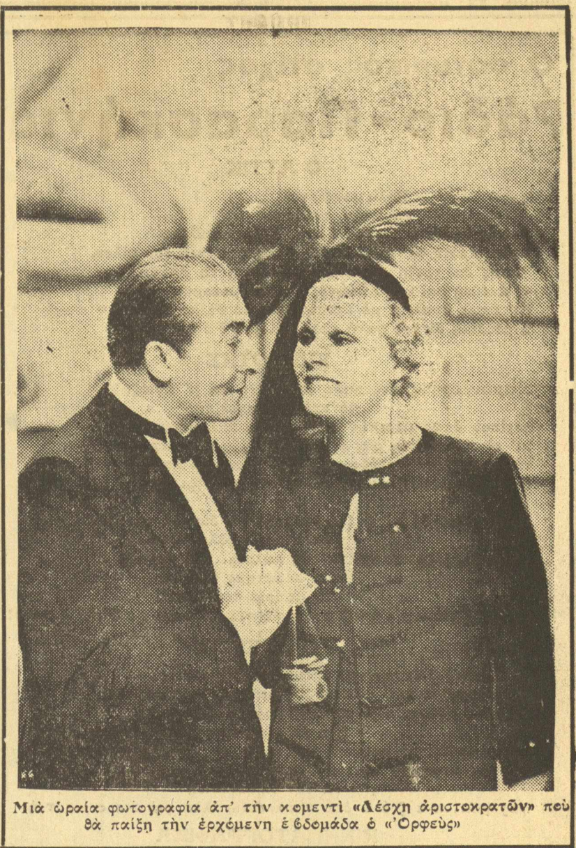
Μιά όμοια φωτογραφία απ' την κομεντι 'Αλέχη άριστοκρατών που θα παιχί την έρχόμενη έβδομάδα ο 'Ορφέης