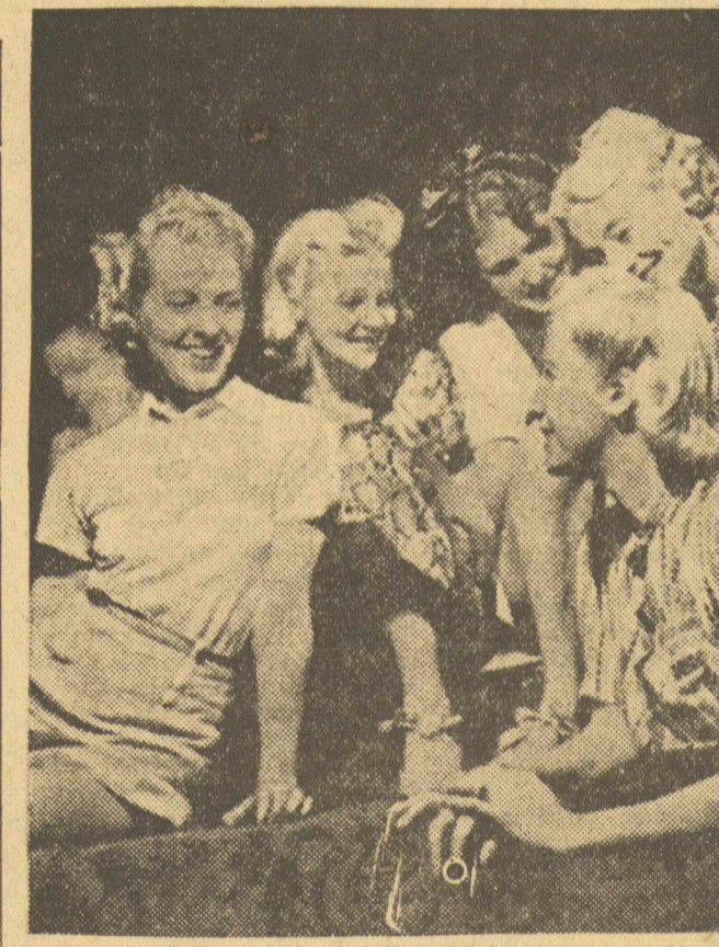
Ἦς πού να ὀυονε στῆ σκηνή τὰ «κεκέρη» μέσα στὴ καμαρίνια δὲν ἀκού- εἰ κανέναν τίποτ' ἄλλο παρά ἕνα εὐχάριστο κουδουνολοῦ, πὸ ἐρωτας εἶνε τὸ κυριώτερο του θέμα.