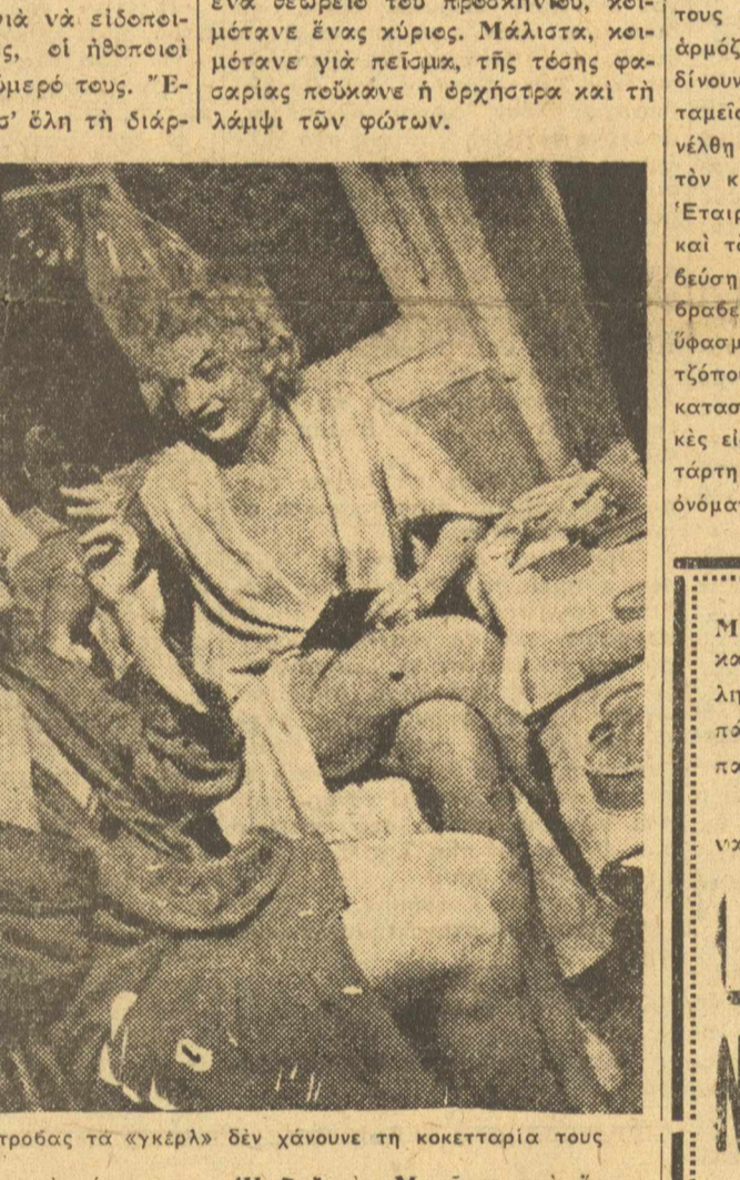
Οὐτὲ τὴν ὥρα τῆς προβάς τὰ «κεκέρη» δὲν χάνουने τὴ κοκκετταρία τοῦς

κινηματογραφικὰ νέα. Ἀρχίζει τὸ γύρισμα τοῦ νέου φιλμ τῆς Οὔφας «Συχολὴ Ἀγάπης». Πρωταγωνιστὴ θάναὶ Ἡ Λουίζα Οὐλριχ, ὁ Βίκτωρ Στάκαλ κτλ.