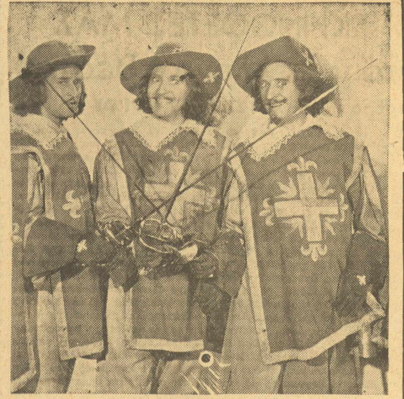
Τὸ ἐξωφρενικό τρίο τὸ γέλατος ΡΙΤΣ ΜΠΡΟΔΕΡΣ πὸ ἐμφανίζει στῆν πιὸ σπαρταριστὴ δημιουργία του στὸ ἀθάνατο ἔργο τοῦ Α. Δουμά «Οἱ τρεῖς συμποφύλακες» διασκευασμένο σὲ μιά ἐγκαρδιστικὴ μουσική παρωδία πού θά προβάλλη ἀπὸ τὴν Δευτέρα τὸ «ΑΤΤΙΚΟΝ»

Είσοδος ήσπεριών. Παρασκηνία, Καμπαρίνια. Πισω απ' τις σκηνογραφίες. Λέξεις που ή μαγειρί τους πα- ρά τις άδικαιρισίες πούχουν κάνει, μέσα στο κινηματογράφο, τὸ ραδιό- φωνο, τὴ φιλολογία, κρατούν τὴν ἀξία πού είχαν κί' άλλτε. Τῆς μα- γείρισας δὲν τῆς ἀρέσει καθόλου, αίλειο τῶν πρωταγωνιστριῶν κί' χορευτριῶν. Γιά τὴν ὥρα, εἶναι ἀδύνατο νά τολήση νά σκεπῆ κανέναν γιά κάτι τέτοιο. Τά κουδούνια χτυπᾶ- νε συνάχεια σ' ἕλες τῆς μεριάς. Κί' μετά ἀρχίζει τὸ μέγαφωνο νά δίνει μουσική πότε στένα πότε στ' ἄλλο