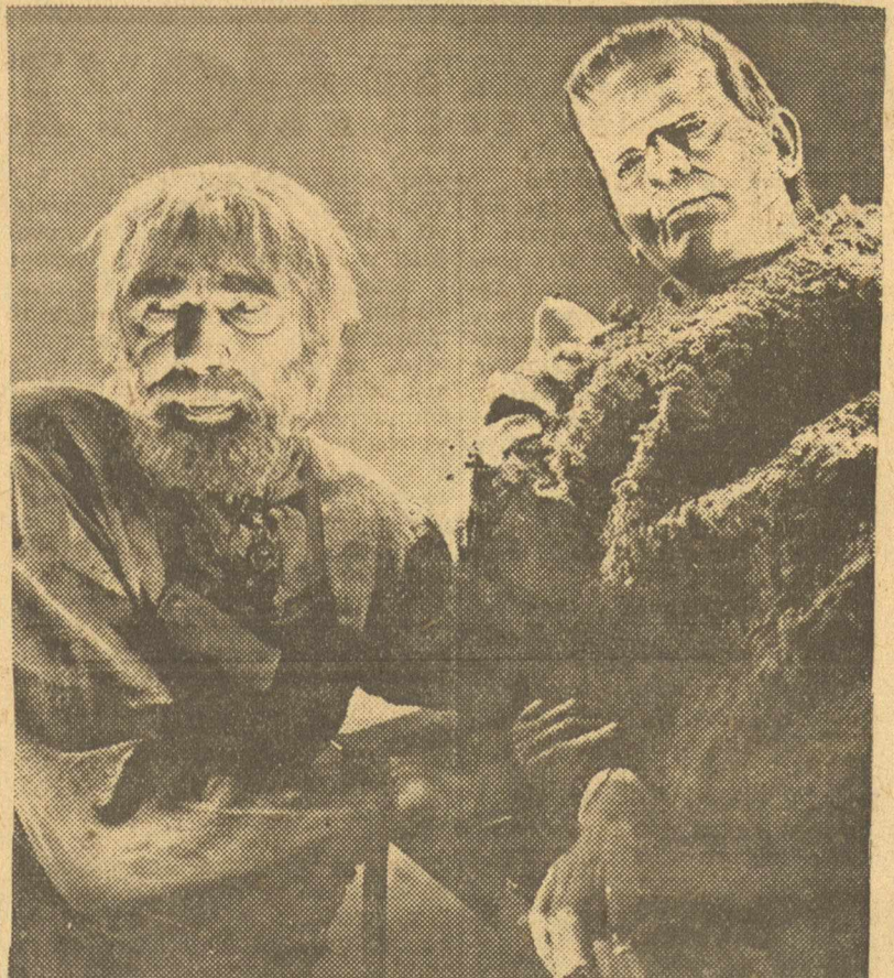
Ο ΓΥΙΟΣ ΤΟΥ ΦΡΑΝΚΕΝΣΤΑΙΝ. Το περίφημο έργο ΓΚΡΑΝ ΓΚΙΝΙΟΛ που πρωταγωνιστής είναι ο ΜΠΟΡΙΣ ΚΑΡΛΩΦ, Μπαζίλ Ράμπσον και Μπέλλα Λουγκέζι και που θα προβληθή την Δευτέρα στο «ΠΑΝΘΕΟΝ»