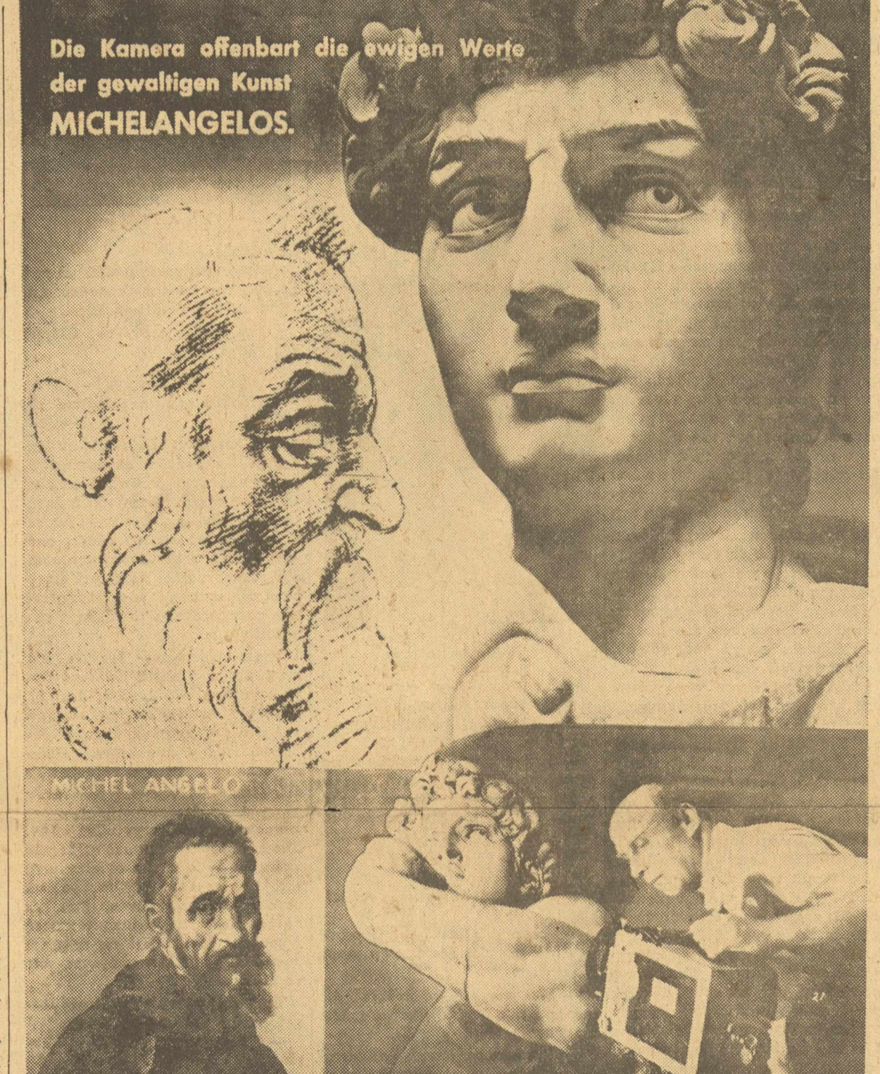
Die Kamera offenbart die ewigen Werte der gewaltigen Kunst MICHELANGELOS.

Σε λίγες μέρες ανοίγει τις πύλες του ο νέος κινηματογράφος, αληθινό στολίδι της Αθήνας, ο «Εσπερος». Εκεί που άλλοτε είχαμε συνήθει να βλέπουμε το κλασικό «Σπλέντιτ» που με τις βαρείες μαρκίζες του θύμιζε μια εποχή παλιότερη, τώρα δημιουργήθηκε μια μοντέρνα καιροφωτισμένη και κομψή αίθουσα που ανταποκρίνεται σ' όλες τις απαιτήσεις της σύγχρονης άνεσης και της αισθητικής. Πόσο μεγάλη με ταίριφφωσι αλήθεια! Τίποτα δεν υπάρχει που να θυμίζει την παλιά αίθουσα. Τα παλιά καθίσματα, δώσανε τη θέση τους σε άλλα, καινούργια, τελευταίου τύπου «σοουφλέ» άγγλικά. Η θόνη άλλαξε κι αυτή. Πήρε ένα μοντέρνο σχήμα, ντύθηκε με πλούσιο δελουδο μαρόν, κι έτσι μοιάζει να μας παρουσιάζει τις πιο εκλεκτές δημιουργίες. Το χρώμα που επικρατεί παντού είναι το χρυσάφι. Ένας πλούσιος φωτισμός δίνει μια ξεχωριστή φαντασμαγορία τόσο μέσα στην αίθουσα όσο και έξω στην πολυτελέστατη είσοδο. Αλλά η μάστιγα ή τελευταία φωτιστική με νέον τύπου σωλήνων «Γκέλλερ», που λόγω του αερίου που περιέχουν δίνουν ένα ευχάριστο από χρώμα και ξεκουραστικό φως όμοιο με του ήλιου. Ειδικό μηχανήμα που αποτελείται από «τραγαλιστικά πηνία» —ένα είδος πηνίων «Ρίγκφорт»— ανάβει και σβήνει διαδοχικά τα φώτα με τρόπο ώστε το μάτι να μην πέφτει απότομα από το δυνατό φως στο σκοτάδι κι αντίθετα. Για να πάρετε μια ιδέα των χρηματικών ποσών που δαπανήθηκαν γι' αυτή την ανακαίνιση, α-