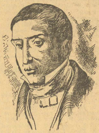
Ο Εύγενης Σκριμπ

τους δημιουργούς των λογοτεχνικών αυτών έργων και τον τακτικό του στο να τελεστεί κάθε πράγμα στη θέση του ήταν αξιοθαύμαστο. Συνεργάτες του από τους πιο στενούς ήταν ο Ντυπέν, ο Ντελαβίν, Ντελέρ-Ποκρσέν, ο Μπραζιέ, ο Λεγκουέ κ. ά. Σε παραγωγικότητα ο Σκριμπ ξεπερνά κάθε σύγχρονο του της ίδιας σχολής, γιατί αυτές ο πιο άγχιπτος στο κοινό απ' όλους τους άλλους κωμωδογράφους δεν δυσκολεύεται καθόλου να χειριστεί το κερφάλι του με τα δώδεκά του χρόνια να δώσει πια κινή την θεατρική μορφή που πρέπει.