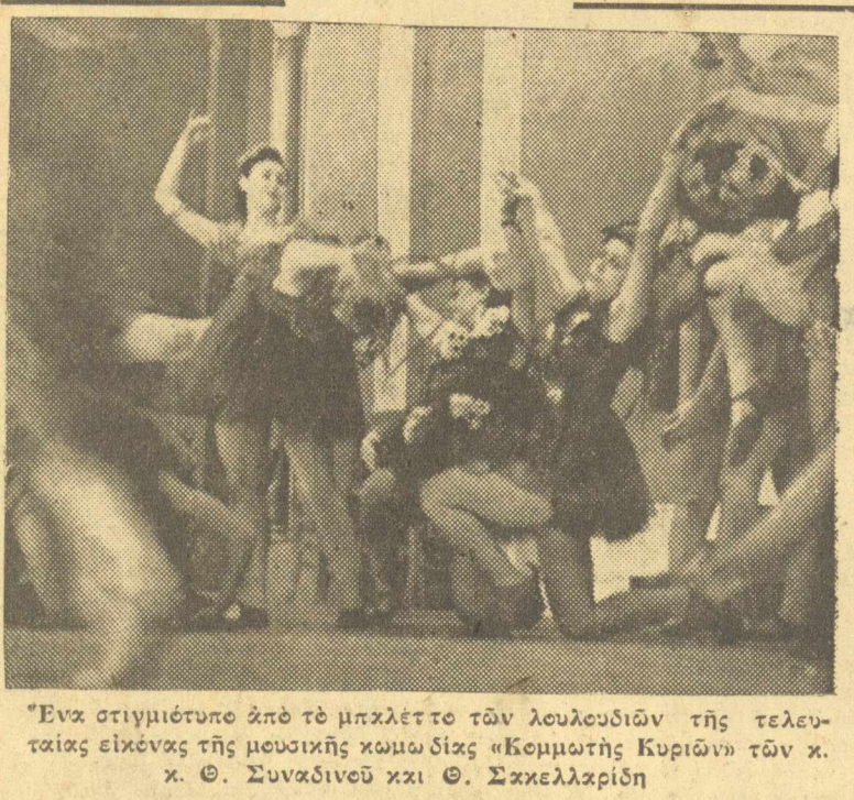
Ενα στιγμιότυπο από το μπεκέτ των λευκοειδών της τελευταίας εικόνας της μουσικής κωμωδίας «Κομητιόφι Κυριών» των κ. κ. Συναδίνου και Θ. Σκαλελλαρίδη.