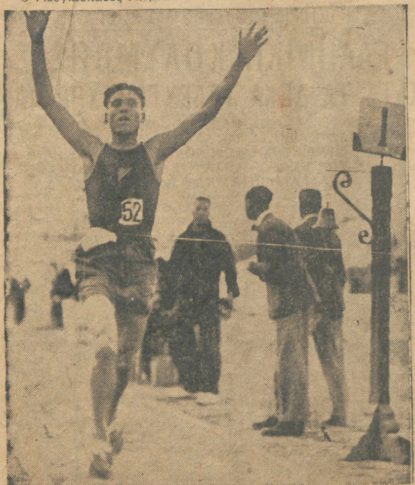
Ο Ρουμάνος δρομεύς άσσοσ Ντίνοσ Κρίστια τερματίζων κατά τους περιουδούς Βαλκανικούς αγώνας και κέρδιον τον πρωταθλητή μας στον δρόμο 800 μέτρων. Άνακηρυχθείς νικητής στο δρόμο 1500 μέτρων παρ' ότι έτερμάτισε δεύτερος!

Ακοντισμός 6ος με βολήν 53.63. Τελικός 100 μ. 5ος εις χρόνον 11''2. Σκυταλοδρομία 4x400 μ.