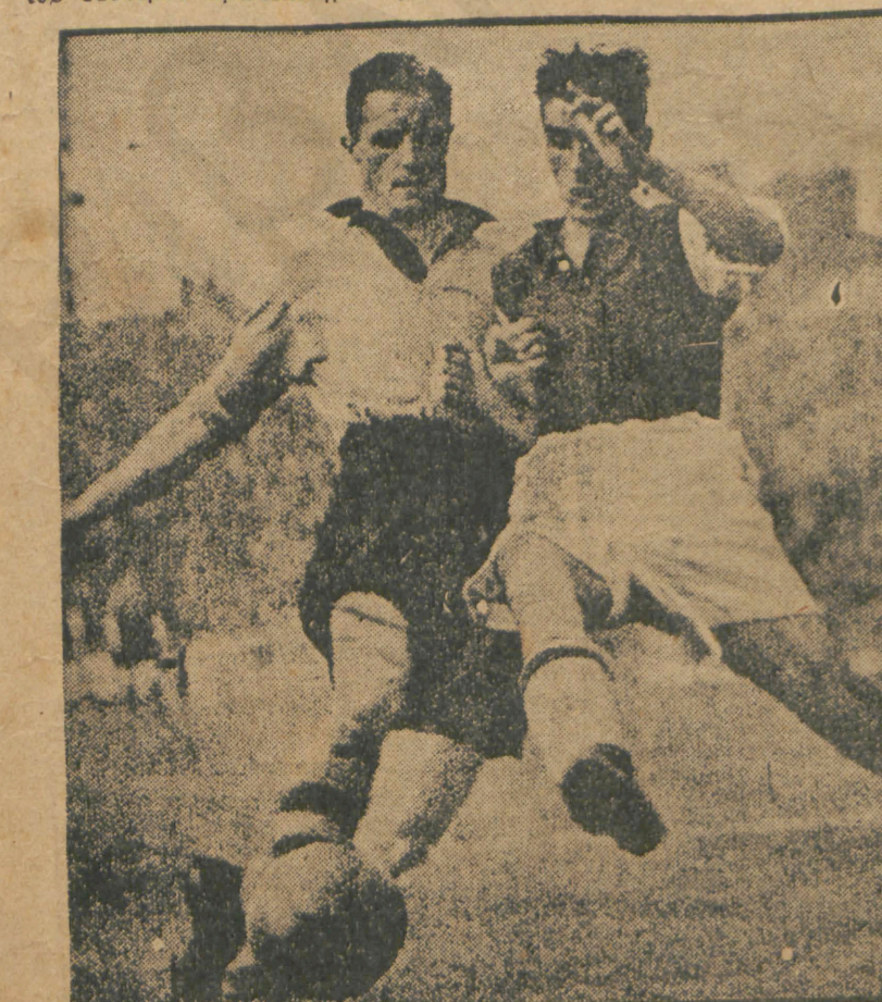
Η συμμετοχή των Νοτιοαμερικανών στο παγκόσμιο ποδοσφαιρικό πρωτάθλημα τō 1938 θα προσδώσ στους άγόνες του τεραστίν ένδιαφέρον και θα παρουσιάσ σκληρές συγκλονιστικές φάσεισ όπωσ ή άνωτέρω

στη, όπωσ τήσ κράτη της Νοτίου Αμερικής άπόσπον από κάθε άγώνα που θα έκανον οι Εύρωπαιοί. Άφορη ή αυτό έβασε ή άδίκηται τήν όποιαν Έκαναν οι όργανωται του ποδοσφαιρικού ολυμπιακού τουρνουά εις βάρος του Περού, τō όποιο ηναγκάσθη να άποχωρήσ τελικός των άγώνων. Ήδη όμως οι σχέσεις μεταξύ Φ.Ι.Φ.Α. άφ' ένος και τών κρατών της Λατινικής Αμερικής άφ' έτέρου έχουν συζητησ παρά πολύ, ώστε οι Νοτιοαμερικανοί να άποκτήσον εκ νέου τήν έμπαρτσόνην που είχαν προς τόν Διεθνή Ποδοσφαιρικόν όργανισμόν.