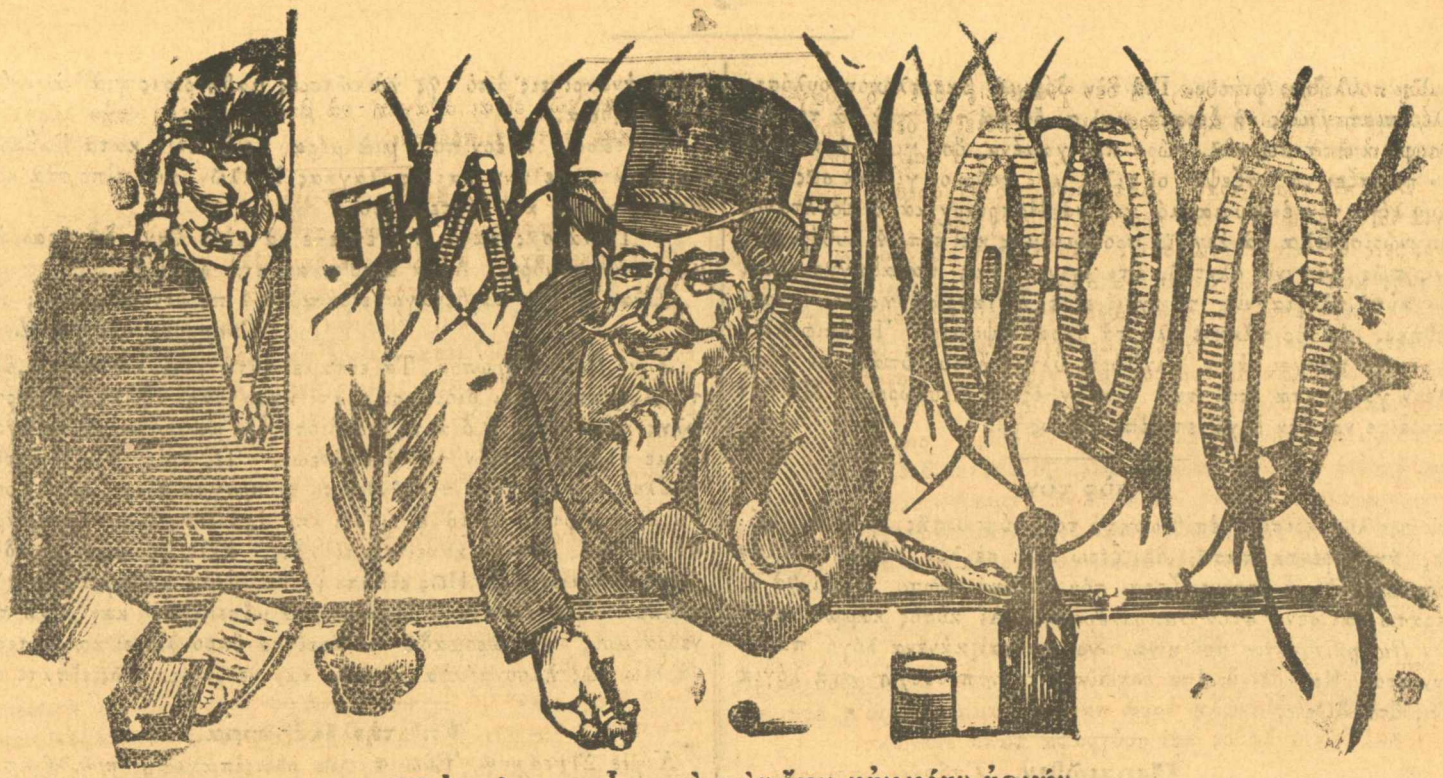
Ἡ ἀρχή μου εἶναι, νὰ μὴν ἔχω κάμμειαν ἀρχήν.