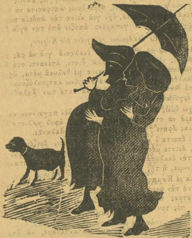
Τύπος Μαγδαλιῶν παρθένων.

Δέν μας λές πώς όλα μας είναι για τὰ μάτια, ως πού νά βγάνομε κάμμια όρα μονάχοι μας τὰ μάτιαμας, κουβαλοῦντας μ' αὐταίς τῆς ἐξαιρέσεις καί καταπατήσεις τῶν νόμων, κάμμια σκουρδούλα ἢ πανούκλα καί θανατικό.