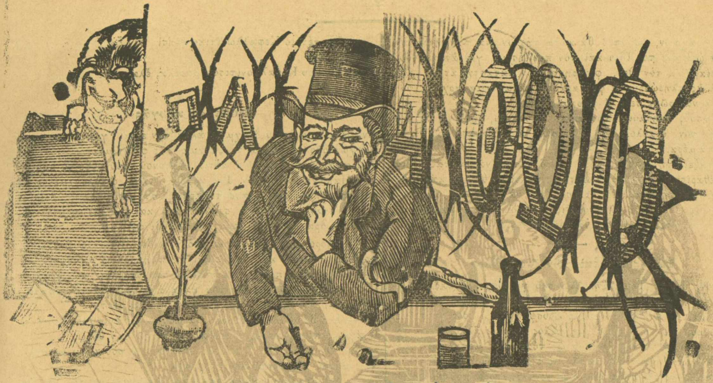
Ἡ ἀρχή μου εἶναι, νὰ μὴ ἔχω κάμμιάν ἀρχήν.