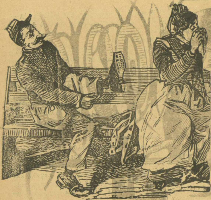
Νεσούλεκτος κάνει εξγολαβία με το κοιζιτικό του.

Δέν μας λές πώς όλα μας είναι για τὰ μάτια, ως πού νά βγάνομε κάμμια όρα μονάχοι μας τὰ μάτιαμας, κουβαλοῦντας μ' αὐταίς τῆς ἐξαιρέσεις καί καταπατήσεις τῶν νόμων, κάμμια σκουρδούλα ἢ πανούκλα καί θανατικό.