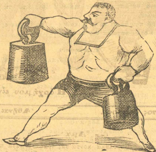
Ὁ Κουταλιανός πού ἦρθε χθές.

Σημ. Παληοθρώπου. Ὡστε ἡ κυρά δασκάλες σας αὐτοῦ τὸ πᾶν σὰν τὴν παροιμία: Ὅποιος δέν σώνει νὰ βαρέσῃ τὸν γάδαρο χτυπᾷ τὸ σαμαρι. Ἐπειδὴ τῆς κατακρατᾷ τὰ διδαχτρα ἡ κύρ διευθύντρια ξεθυμένουν στὰ κορίτσα σας. Ὡραία σκέψις. Πλήρωσε, ἀδερφέ, κυρία διευθύντρια, στὰ κορίτσα τῆς δασκάλαις ὅτι κάνει νὰ λαβαίνουν και νὰ μὴ βρίζουν τὸν μελᾷ τους τὰ κορίτσα μας. Ψὲ διάολε.