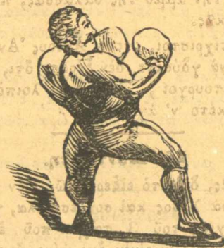
Ὁ Κουταλιανός παλεῖ με τὸν ἑαυτόν του.

Σημ. Παληοθρώπου. Τώρα πού σοῦ πῆρε τὸ λιθορθερ δέν σὲ φοβάται. Ἐπειτα ξαδερφία εἶστε, σοῦ τόκανε ἔτσι χωρατὰ για νὰ σὲ φουρκίσῃ. Μὴ μαλώνετε, συγγενεῖς εἶστε. Δός το ἀδερφέ και σὺ τὸ λιθορθερ. δέν εἶναι χωρατὰ αὐτὰ. Δέν ἀκοῦς πού θὰ σοῦ κάνη και ἀγωγή; Τὸν ρωτᾷς τὸν ἄνθρωπο ἀν ἔχη παραδες νὰ πάρη και ἄλλο; Ἄμ δᾷ.