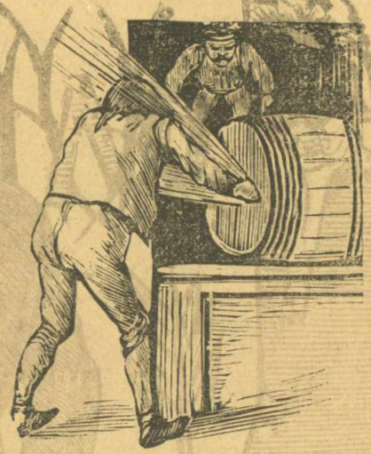
Κλεφτοκρασᾶς. Βάσια ρε και με πήρε τὸ στουπὶ κατὰ μοιτρα και δὲν προφτάρω να πιῶ

τῶν κλεφτῶν Γιαταγάνια και συντροφία ἀπὸ τῆς φυλακαίς τοῦ Τριγγέτα, τίποτα ἄλλο δὲν ἀποδείχνει παρὰ τὴν ἀπλὴ τέχνη τῶν κλεφτῶν και τὴν βλακειὰ ἐκείνων ποῦ ἔδωκαν τὴν ἀδεια σε τέτοιους κακούργους να μεταφερθοῦν στὸ νοσοκομεῖο και τὴν τσαρλατοσύνη κεινοῦ τοῦ γιατροῦ ποῦ ἐπίστατο πούησε ὅτι ἦταν ἀρρώστος.