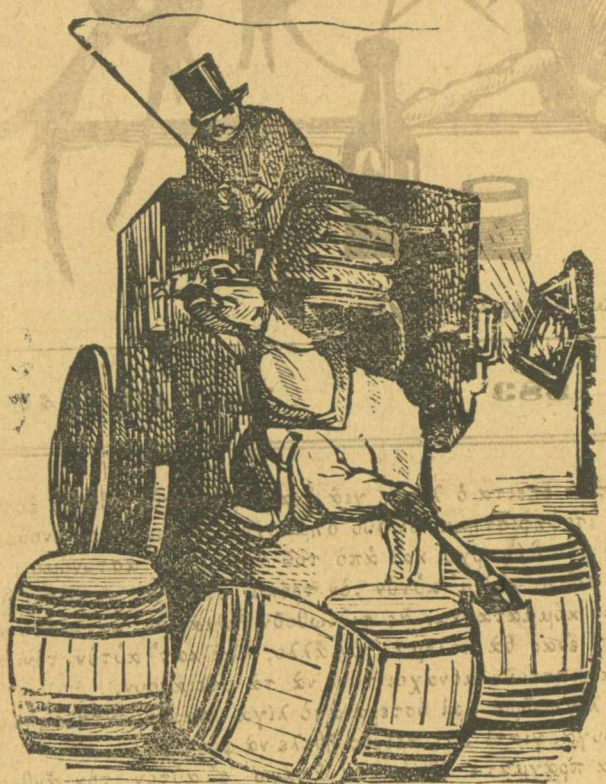
Νὰ πὼς κατάντησαν οἱ δρόμοι ἀπὸ τὸ βαρὸ λοκαθάρισμα

Αὐτὰ σὰς τὰ γράρω ὄχι για να ὑπεραστιστῶ τὸν Βενιό, ἀλλὰ για να σὰς δείξω τί τρισάθλια ὄντα εἴμαστε μεῖς οἱ ρωμνοί, ὥστε ἕνα τυποτένιο πράγμα, μιὰ γυναικοδουλειά, νὰ τὴν κατανοῦμε ζήτημα ἀνατολικῆ, και γινόμαστε ρεζίλιδες σ' ὅλο τὸν κόσμο.