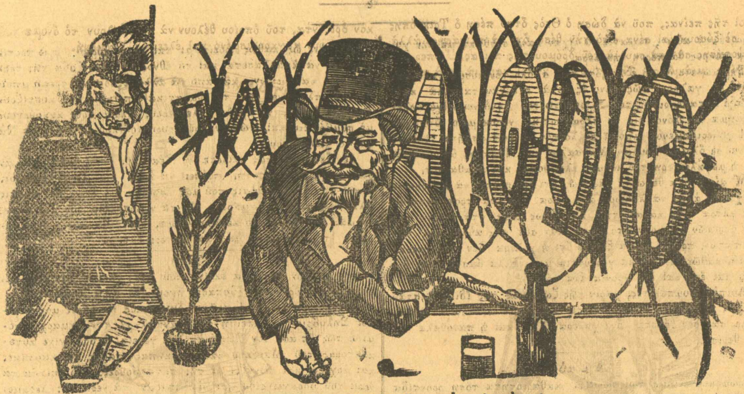
Ἡ ἀρχὴ μου εἶναι νὰ μὴν ἔχω κάμμειαν ἀρχήν.

ΦΡΟΙ ΑΠΑΡΑΒΑΤΟΙ. —Συνδρομὴ προπληρωτῆα στὴν Ἑλλάδα 12 δρ. στὸ δέξω τῆς Ἑλλάδος 15. Ἐκδίδεται τρίς τῆς ἐβδομάδας, ἀπὸ 7-8 χιλιάδες φύλλα. Γιὰ κάμμειαν καταχώρησι δὲν ἔχει πληρωμὴ, οὔτε γιὰ τὰς ἴωστοποιήσεις. Κάμμειαν καταχώρησι εἴτε τυπωθῆ, εἴτε μὴ, δὲν ἐπιστρέφεται. Ὅσοι μᾶς στέλλουν γράμματα πρέπει νὰ ἔχουν πάντοτε ὑπογραφή, καὶ ἡ ὑπογραφή τους θὰ τυπώνεται. Διάφευσις κάμμειαν δὲν γίνεται, καὶ ὅσοι θέλουν νὰ κάνουν τέτοιαις ἄς πᾶν σ' ἄλλαις ἐφημερίδαις. Γράφε ξεγράφε δὲν ἔχει. Ὅσοι γράφουν πολλὰ, νὰ ξέρουν πῶς τὰ γράμματά τους δὲν θὰ διαβάζωνται.