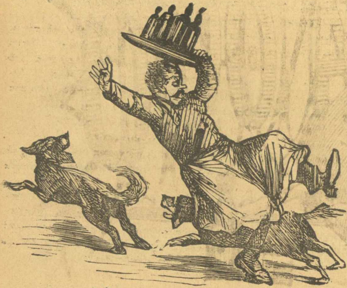
Ὅριστε τί κάνει τὸ κυκλολόγιον.