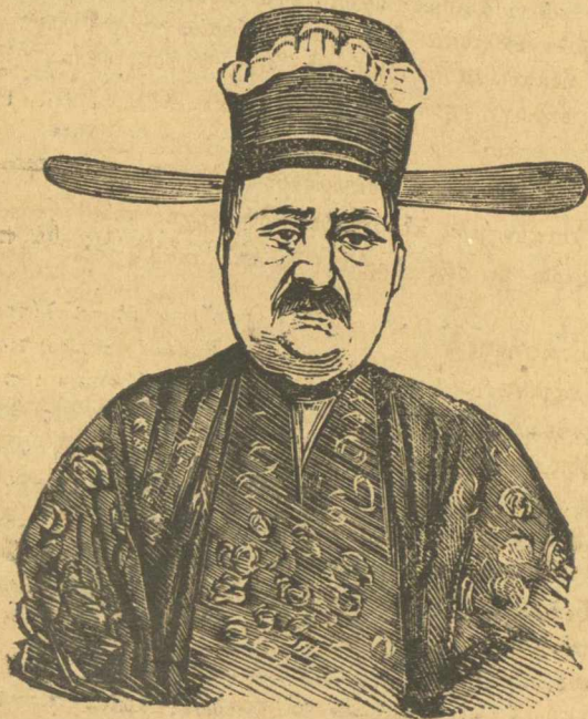
Ὁ ἀρχι ἀνα ἄνω τῆς Ἑλλάδος

ἔχω νὰ σᾶς διηγηθῶ μιὰ νόστιμη ἱστορία, γιὰ ἕναν ποῦ ἔκανε ἀγωγή καὶ δικάστηκε δῶ, γιὰτὶ τοῦκλεψε τὸ γατάκι τοῦ ἑνάτος φίλου σου καὶ τοῦ γυρεῦει δὲν ξέρω κ' ἐγὼ πόσα. Τὰ μαλιὰ τῆς κεφαλῆς του, γιὰτὶ λέει ἔστω μὲ νὰ τοῦ ἔκλεψε ὁ φίλος του τὸ γατάκι δὲν ὑπαρχε γατάκι νὰ τοῦ φάη τοὺς ποντικούς, καὶ ἔστω μὲ τὸ νὰ μὴ φοβόντουσαν οἱ ποντικοὶ τὸ γατάκι, τοῦ ἔφαγαν ὅ,τι ἔφαγαν, καὶ τοῦ λόγου τούτου ἔνεκα τοῦ γυρεῦει τὴν ἀποζημίωσι δὲν ξέρω καὶ γὼ πόσα. Νὰ τι κοστιζῆ ἕνα κλέψιμο γάτου καὶ γιὰ νὰ μὴ νομίζετε πῶς σᾶς ψευτιζῶ αὔριο σᾶς δημοσιεύω τὰ ἐπίσημα χαρτιά.